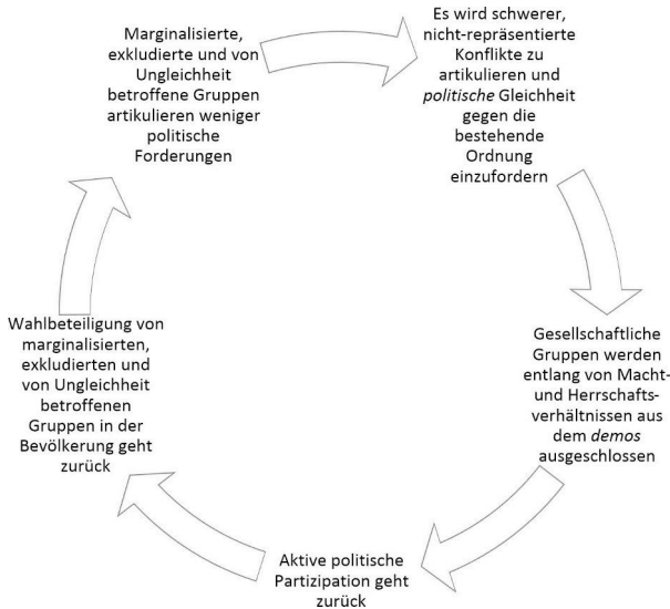
Grafik 6: Teufelskreis der Ohnmacht in der Demokratie

Infolge des in Ohnmachtserfahrungen sichtbar werdenden gebrochenen Versprechens politischer Teilhabe entstehen zwei miteinander verwobene, aufeinander verweisende Dynamiken: Auf der einen Seite verstärken sich unterschiedliche politische Ohnmachtserfahrungen wechselseitig (vgl. Grafik 6).