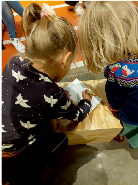
Abb. 3: Aus allen Rückmeldungen lassen sich Erkenntnisse gewinnen. So auch aus den Gemälden jüngerer Besucherinnen, © Museum Industriekultur.

Die Reflexion des begehbaren Besucherbuchs zeigt deutlich die Schwächen und Stärken beim Einsatz von Talkback-Boards als Methode der Ausstellungsanalyse. So sind auch für vermeintlich einfache Methoden wie Talkback-Boards einige Anstrengungen notwendig. Um dem Ziel zu entsprechen, ein möglichst umfassendes Bild vom Ausstellungseindruck der Besucher:innen zu erhalten, ist es notwendig, ein Talkback-Board über einen längeren Zeitraum aufgestellt zu lassen. Denn zwar bleibt die Ausstellung, die analysiert wird, die gleiche, doch die Besucher:innen wechseln und haben unterschiedliche Ansprüche an eine Ausstellung. So bringen Schulklassen andere Rückmeldungen ans Talkback-Board als Familien, deren Rückmeldungen sich aber in den Sommerferien von denen um Weihnachten herum unterscheiden können. Welche Rückmeldungen saisonabhängig sind und welche konstant, lässt sich nur durch eine längere Laufzeit ermitteln. Eine längere Laufzeit erfordert in Folge einen höheren Material- und Betreuungsaufwand, was den Aufwand insgesamt steigert. Somit zeigt sich, dass die Methode nicht schnell