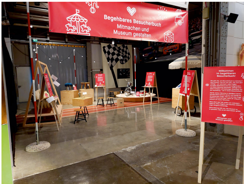
Abb. 1: Willkommen im begehbbaren Besucherbuch .

Das begehbbare Besucherbuch steht in der Dauerausstellung des Museums Industriekultur, welche die Zeitspanne von der Industrialisierung bis zur Gegenwart