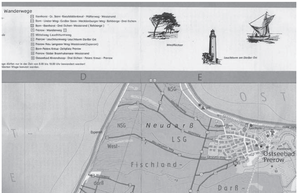
1 Ausschnitt aus der Wanderkarte »Darß – Fischland« von 1986 Kartografie: Tourist Verlag

Die Praktiken der Nichtdarstellung betrafen jedoch nicht nur die grüne Grenze (Landgrenze) zwischen der DDR und der Bundesrepublik bzw. die Mauer in Berlin, sondern auch die nasse Grenze an der Ostsee. Auf der Wanderkarte »Darß – Fischland« (Maßstab 1:50.000, Landkartenverlag, 1. Auflage 1971) wurde die Nordspitze der Halbinsel Darß inklusive der vorge-lagerten kleinen Bernsteininsel gekappt, obwohl ein als »Leuchtturmweg« ausgeschilderter Wanderweg in der Karte mit einer Markierung gekennzeichnet war und eine Vignette im Kartenrand auf den nur wenige hundert Meter entfernten Turm als Sehenswürdigkeit hinwies (vgl. Abb. 1 5 ). Doch um diesen herum befanden sich ab 1962 diverse Einrichtungen der Nationalen Volksarmee (NVA) und so wurde die Spitze der Landzunge zum