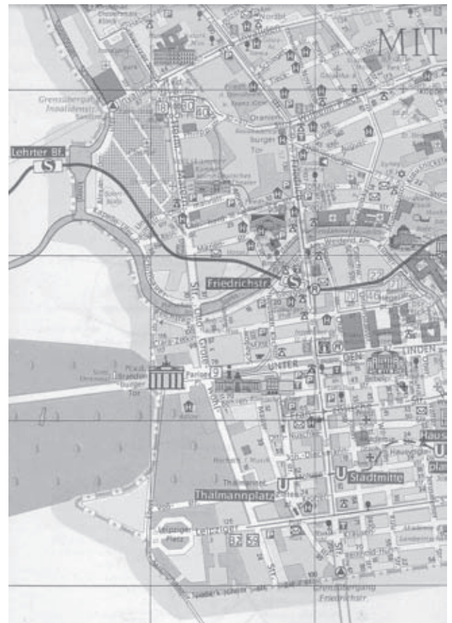
2 Straßenübersichtsplan »Berlin« von 1957 (links) und Stadtplan »Berlin – Hauptstadt der DDR« von 1972 (rechts) Kartografie: Landkartenverlag bzw. Tourist Verlag