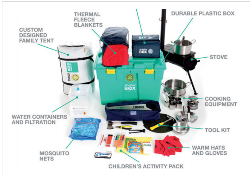
Abbildung 31: Die Überlebensboxen der Katastrophenhilfeorganisation ShelterBox könnten bald einen GPS-Sender haben.

Die Spender wollen sehen, was mit ihrer Spende passiert – zum Beispiel mithilfe von Sensoren. So hat kürzlich eine Trinkwasserorganisation Sensoren in Brunnen installiert und meldet in Echtzeit, ob alle Brunnen laufen. Und die Katastrophenhilfeorganisation ShelterBox experimentiert mit GPS-Sendern an ihren Nothilfe-Sets. So kann der Spender in Echtzeit sehen, dass seine Hilfe ankommt. Das Internet of Things wird in absehbarer Zeit Einzug in den sozialen Sektor halten und das Thema Transparenz auf ein ganz neues Level heben.