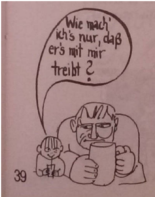
Abb. 1: Täter-Opfer-Umkehr in einer Broschüre des Schwulenbereichs der Westberliner Alternativen Liste, 1980. 13

Hinzu kam ein spezifischer Jugendkult, der eng verknüpft war mit einer Idealisierung des antiken Konzepts des ›pädagogischen Eros‹, in welchem ein älterer und sozial höhergestellter Mentor einen jüngeren ›Knaben‹ in die Sexualität und darüber in einen Kosmos erwachsener Männlichkeit einführte. Dieses Konzept blieb trotz Befreiungsrhetorik und der zunehmenden Bedeutung egalitärer Beziehungsmodelle weiterhin präsent. Mehr noch: in einer Umkehrung der realen Machtverhältnisse wurden nun die Kinder zu Verführern der Erwachsenen stilisiert. Pädosexuelle Männer konnten so als Erfüllungsgehilfen kindlicher Bedürfnisse gelten. 14 Die Erfahrung vieler schwuler Männer der 1970er und 1980er Jahre, ihre eigene sexuelle Identität