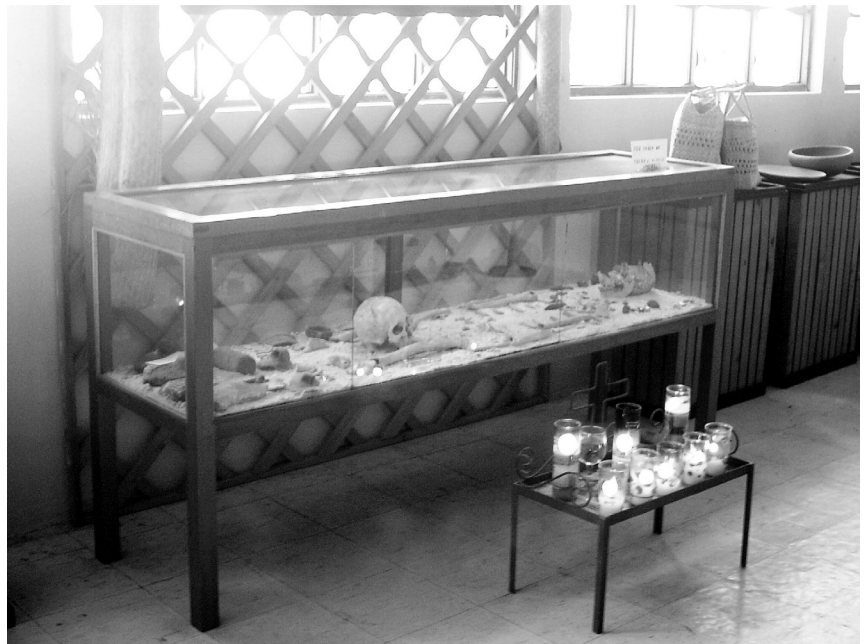
Abb. 4: Altar der Ahnenverehrung vor einer Vitrine mit den Überresten einer Bestattung im Museum von Uatatlán.

türliche Bedeutung hatten. Weiter berichtet Robert Carmack (1981: 356) von einer indigenen Miliz, die sich noch Ende des 19. Jahrhunderts vorspanischer Insignien und Musik bediente und eine Versammlung in den Ruinen von Uatatlán abhielt, bevor sie in den Kampf zog. In den 1920er Jahren, bemerkte der Archäologe Samuel Lothrop (1929: 10) dort auch rezente Spuren ritueller Feuer, die von der indigenen Bevölkerung aber unter dem Schutt der zerstörten Gebäude verborgen wurden, offenbar um ihre rituelle Nutzung dieses vorspanischen Zentrums geheim zu halten. So finden bis heute Rituale in den Ruinen von Uatatlán statt, bei denen religiöse Spezialisten die Geister ihrer vorspanischen Ahnen anrufen. Auch in anderen Gemeinden hat sich bis zum heutigen Tag eine Erinnerung an vorspanische Herrscher erhalten. Diese Individuen sind nach traditioneller Auffassung niemals gestorben, sondern ruhen in den umliegenden Bergen, von wo sie eines Tages zurückkehren werden, um den Gemeinden in Notzeiten beizustehen. 11