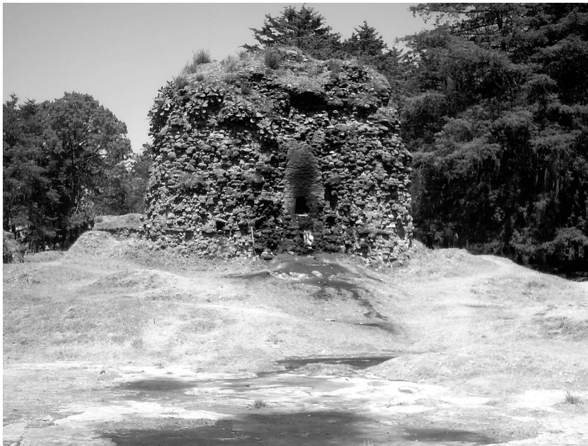
Abb. 3: Ruinen des Tojil-Tempels in Uxatán. An dem Gebäude und auf dem Platz sind Spuren ritueller Feuer erkennbar.