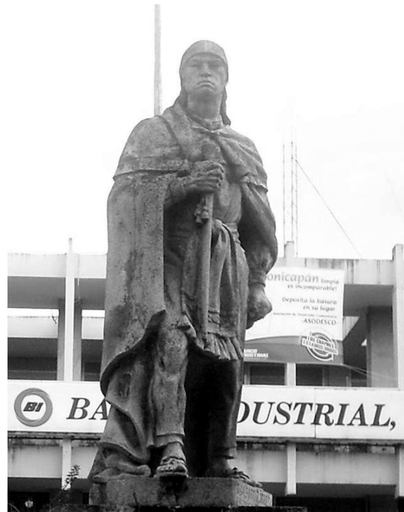
Abb. 1: Denkmal für Atanasio Tzul in Totonicapán.

wir auf verschiedene Hinweise, die nahelegen, dass die Ereignisse in Totonicapán durchaus in einer historischen Kontinuität zu begreifen sind, die Züge einer Heilserwartungsbewegung aufweist.