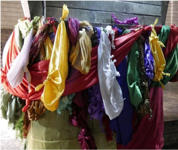
© Liane Süßmuth-Wemhöner (2018): Heiligtum Scheich Adis in Lalisch, Halle der Versammlung

In der „Halle der Versammlung“ befindet sich das Grabmal Scheich Adis. Am Grabmal und an Säulen im Inneren sind bunte Seidentücher befestigt. Es ist Brauch, drei Knoten ( girêk ) aufzuknöpfen, drei Knoten zu binden und diese zu küssen. Die verschiedenen Farben stellen die sieben Engel dar, während jeder Knoten ein Gebet verkörpert. Eziden glauben, dass durch das Lösen eines Knotens eines früheren Pilgers dessen Wünsche erfüllt werden.