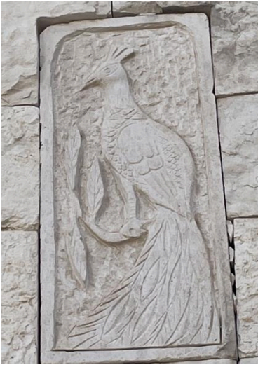
© Liane Süßmuth-Wemhöner (2022): Pfauen-Symbol in Lalisch.

Das Pfauensymbol wird von den Eziden als religiöses Erkennungszeichen in vielfacher Weise verwendet. Es ist ein fester Bestandteil der nach außen sichtbaren religiösen Identität. Dabei wird es nicht nur als Schmuckstück am Körper getragen, sondern zierte auch als Malerei die religiösen Gemeindegemeinschaften der Eziden. Der Pfau findet sich ferner als Symbol auf Grabmäthern einiger mythischer Figuren, aber auch auf Gräbern verstorbener Eziden und wird auch in der modernen Architektur vielfach verwendet.