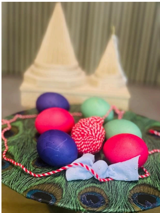
© Ibrahim Kus (2022): Bunt bemalte Eier mit einer basimbar-Binde, die für das Neujahrsfest geflochten wird.

enthielt, aus denen das Universum geformt wurde. 14 Die Perle als Symbol der Schöpfung findet sich auch bei anderen religiösen Traditionen des Nahen und Mittleren Ostens. 15 Die Perle verkörpert bei den Eziden den Urzustand der Welt. Da sie selbst aus Gottes Licht erschaffen wurde, sind alle Bestandteile der Welt Teil des göttlichen Lichts. Dies ist ein wesentlicher Grund, warum Eziden nicht an das „Böse“ als Prinzip oder als antagonistische Kraft zu Gott glauben. Denn alle weltlichen Dinge sind ihrem Wesen nach gut, bestehen ihrer Substanz nach aus Licht, und ein absolut Böses kann es daher nicht geben, denn dieses bestände nicht aus Licht 16 und widerspräche der Allmacht Gottes. Nach ezidischer Überzeugung bewirkt