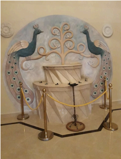
© Ibrahim Kus (2022): Malerei im Inneren der Heiligen Stätte „Siltan Ezi“ in Tiflis (Georgien)

Die ezidische Religionsgemeinschaft ist in hohem Maße anpassungsfähig. Die Transformation religiöser Praxen zeigt sich etwa anhand der sog. Tausi-Melek-Standarten (sanjaks). Diese Standarten wurden aus Bronze oder Eisen hergestellt und stellen vogelartige Tausi-Melek-Symbole dar. Mit den sanjaks unternahmen die Qewwalen, die Kenner und Rezitatoren der religiösen heiligen Texte der Eziden, früher regelmäßig Rundreisen durch die von den Eziden bewohnten Regionen (tawûs gêran).