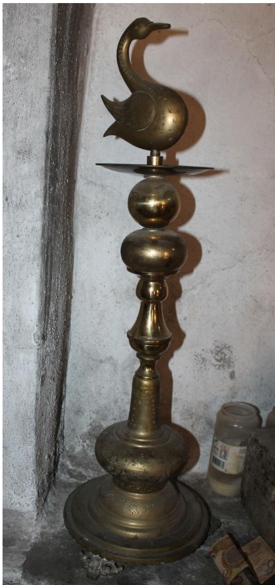
© Liane Süßmuth-Wemhöner (2022): sanjak-Standarte in Ba'adre (Irak)

onsmittel noch schriftliche Quellen gab, war das Ritual der sanjak-Rundreise die einzige Möglichkeit, die orale Tradition sowie die Einheit der Ge-