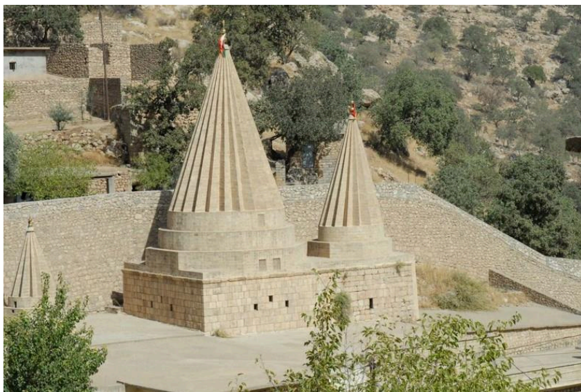
Heiligtum Scheich Adis in Lalisch

Zentrale Bedeutung hat das Heiligtum „Scheich Adi“, das dem gleichnamigen Heiligen und Reformier der Religion gewidmet ist und von dem die Eziden annehmen, dass sie es seit seinem Bestehen nutzen. Andere sind der Ansicht, dass es vor der Nutzung durch die Eziden eine nestorianische Kirche gewesen sei, was die Architektur nahelegen soll. 22 Vermutet wird zum Teil auch die ursprüngliche Verwendung als Mit(h)ra-Tempel, da es auf einer Wasserquelle errichtet wurde. 23 Über der Grabstätte Scheich Adis erheben sich zwei große Kuppeln (qube). Eine dritte kleinere Kuppel befindet sich über dem Grab Scheich Obekrs, das ebenfalls zum Scheich Adi-Heiligtum gehört. Das Grab Şeşims wird von einer großen Kuppel überragt und befindet sich in der Nähe des Heiligtums Scheich Adis. Vor dem Heiligtum Scheich Adis befindet sich der sogenannte „Bazar der mystischen Kenntnis“ (Sûqa Me'rifetê), ein großer Platz, an dem sich die Pilger während der Feste aufhalten und feiern.