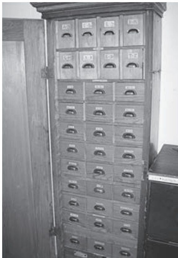
Abb. 6: Deutsches Kunstarchiv: Karteischränke der Galerie Heinemann