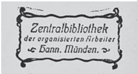
Abb. 4: Niedersächsische Staats- und Universitätsbibliothek Göttingen: Raubgut aus Gewerkschaftsbesitz