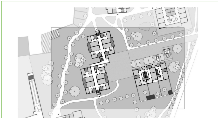
Abb. 1: Die Lage der Wohnungen und Reihenhäuser soll eine Einbindung in die kleinstädtische Umgebung von Meyenburg in Brandenburg ermöglichen.

Dieses Dienstleistungs- und Veranstaltungszentrum liegt inmitten des neuen