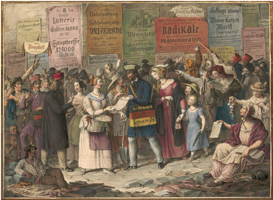
Abb. 13: Johann Nepomuk Höfel, Verkauf der »Wahrheit« zu Wien im Juni 1848 um 1 Kreuzer Conventionsmünze.