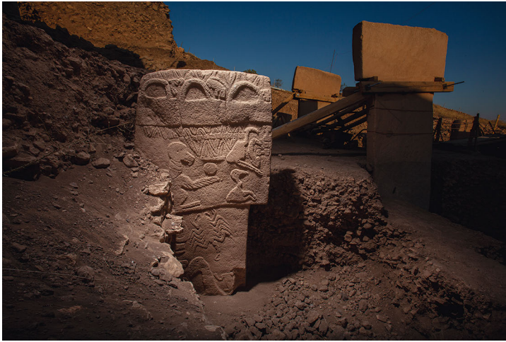
Abbildung 26: Ein Pfeiler des Göbekli Tepe mit verschiedenen Motiven 847

Abbildung 26 zeigt eine circa drei Meter hohe Säule in der Anlage des Göbekli Tepe. Fachleute halten es für möglich, dass anhand des darauf zu sehenden Motivkomplexes Geschichten erzählt werden; deshalb werden sie auch »Mythogramme« genannt. 848 Die oberste Reihe scheint aus Körben zu bestehen, die einen Geier und eine Scheibe enthalten. Auf dem unteren Teil ist dagegen ein Skorpion oder eine Spinne zu sehen – Tiere, die ein Symbol für Gefahr oder Tod sind. Unter anderem anhand der Analyse der abgebildeten Säule nehmen manche Forscher an, dass der Göbekli Tepe – gleichsam als ein frühes Observatorium und darin der Anlage von Stonehenge ähnlich – errichtet worden ist, um dem Auf- und Untergang des Sirius folgen zu können. Dieser Stern ist ab etwa 9300 v. u. Z. das erste Mal am anatolischen Sternenhimmel zu sehen. Das Erscheinen des neuen Objekts löst möglicherweise sogar eine neue Religion aus. 849 Aber auch für diesen Fall trifft zu, dass die Gesellschaftsbildung, deren Teil die Anlage des Göbekli Tepe ist, sich zwar über Religion beschreiben kann, dass aber nicht sämtliche Interaktionen religiös bestimmt sein können: Um etwa die Steine besorgen, formen, arrangieren und mit Motiven versehen zu können, müssen andere als nur religiös bestimmte Organisationweisen bestehen. 850