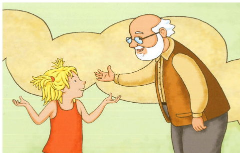
Abb. 81–85: Ältere Männer erklären Kindern Religion, Laube/Zünd: Erklär mir deinen Glauben, S. 11; Brown/ Langley/Gower: Woran wir glauben, S. 8; Vellguth/Witzig: Gemeinsam im Gelobten Land, S. 28f.; Staszewski/Stachuletz/Blumenthal: Mona und der alte Mann, S. 7; Gürz Abay/Demirtaş: Leyla und Linda feiern Ramadan, S. 21.