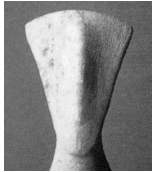
Abb. 2: Idole féminine, Style cycladique (2500-2200 v. Chr.) (Ausschnitt), Paris, Musée de Louvre