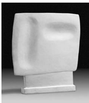
Abb. 3: Alberto Giacometti, Tête qui regard, 1928-1929, Marmor, 41×37×8 cm, Alberto Giacometti-Stiftung, Zürich