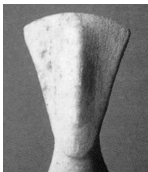
Abb. 2: Idole féminine, Style cycladique (2500-2200 v. Chr.) (Ausschnitt), Paris, Musée de Louvre