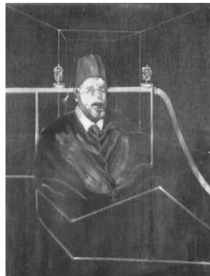
Abb. 6: Francis Bacon, Study Number Six after Velazquez's Portrait of Pope Innocent X , 1986, Öl auf Leinwand, © VG Bild-Kunst, Bonn 2024.