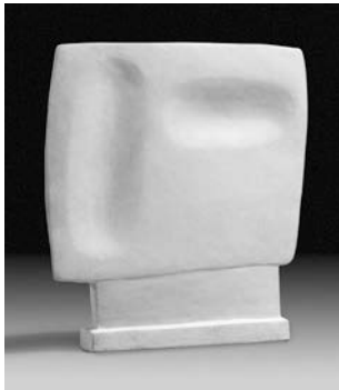
Abb. 3: Alberto Giacometti, Tête qui regard, 1928-1929, Marmor, 41×37×8 cm, Alberto Giacometti-Stiftung, Zürich