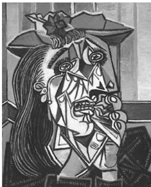
Abb. 5: Pablo Picasso, Weinende Frau , 1937, Öl auf Leinwand, Tate Gallery, © VG Bild-Kunst, Bonn 2024.