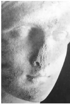
Abb. 1: Kopf einer Frauenstatue, Ostgriechisch, 300/280 v. Chr., Marmor, Höhe 30 cm, München Glyptothek.