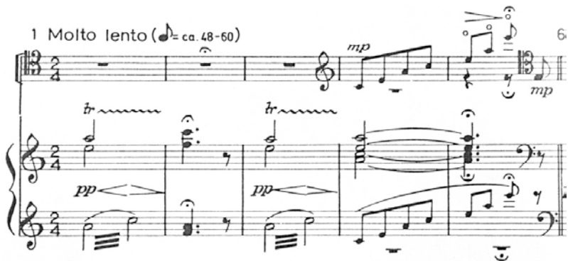
Abb. 7: Auszug der Partitur der Transkription für Violoncello und Klavier von Pablo Casals, El cant dels ocells , ca. 1945.