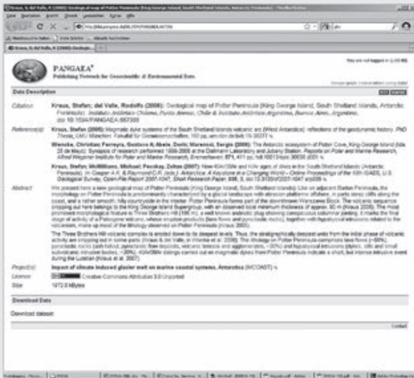
Abb. 4: Vorschau einer geologischen Karte beim Datenzentrum PANGAEA

dem Thema haben, sondern auch an den Datensätzen, die ein bestimmter Wissenschaftler gesammelt hat. Durch die Vergabe von persistenten Identifiern (hier DOI-Namen) werden diese Daten direkt über den Katalog zugänglich. Derzeit sind bereits über 3.500 Datensätze, die Grundlage einer wissenschaftlichen Publikation sind, direkt als eigenständige Objekte über GetInfo und den Gemeinsamen Bibliotheksverbund (GBV) zugänglich [1]. Abbildung 2 zeigt Daten zu einem Bohrkern als Ergebnis einer Suche in GetInfo. Durch Auflösen des persistenten Identifiers gelangt man auf eine Vorschauseite des Datenzentrums, die weitere Metadaten zu dem Datensatz enthält, sowie Download-Links zu einzelnen Teilen des Datensatzes oder den gesamten Daten (Abb. 3). Dieser Workflow entspricht der traditionellen Verwendung von DOI-Namen bei wissenschaftlichen Zeitschriften.