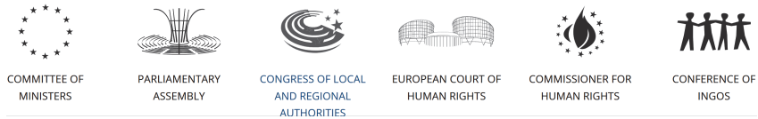
Abbildung 1: Rangordnung der Organe und Institutionen im Europarat

Oberste Repräsentanz des Europarats ist der Generalsekretär bzw die Generalsekretärin (hier nicht wiedergegeben, da kein eigenes Logo), dann folgen protokollarisch das Ministerkomitee, die PV, der Kongress, der Europäische Gerichtshof für Menschenrechte, der/die Menschenrechtskommissar/in und die Konferenz der internationalen Nicht-Regierungsorganisationen.