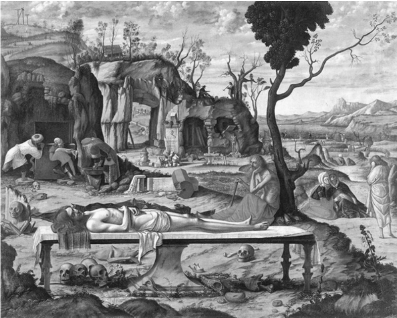
Abbildung 1: Vittore Carpaccio: Grabbereitung , vmt. 1505-1520, Berliner Gemälde Galerie, Staatliche Museen zu Berlin, Preußischer Kulturbesitz, Leinwand 145 cm x 185 cm.