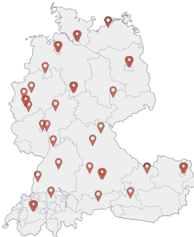
Abb. 1: Alle 35 Tagungsorte der GJZ-Tagungen im D/A/CH-Raum