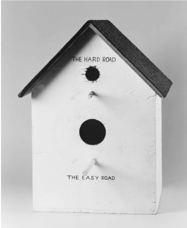
Catholic Birdhouse von Mike Kelley, 1978.