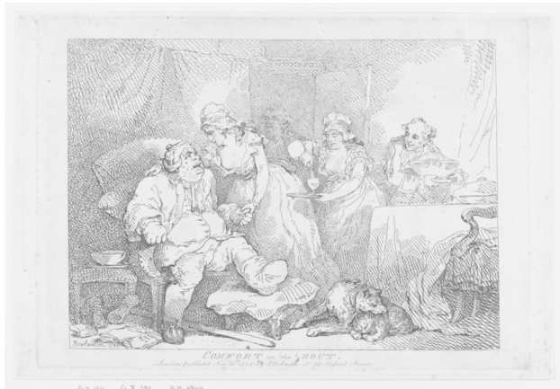
Abb. 43: Thomas Rowlandson: Comfort in The Gout , 1785, Radierung, 255 x 352mm, Metropolitan Museum of Art, New York.

Metropolitan Museum of Art, New York: 59.533.115.