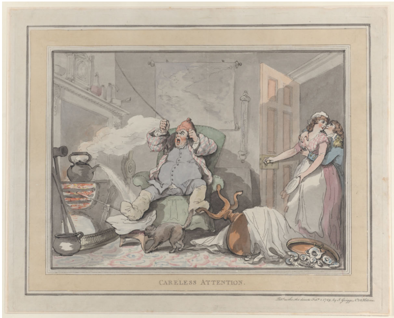
Abb. 44: Thomas Rowlandson: Careless Attention , 1789, kolorierter Kupferstich, 325 x 405mm, Metropolitan Museum of Art, New York.

Metropolitan Museum of Art, New York: 59.533.327.