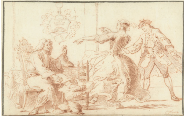
Abb. 45: Cornelis Troost: Der reiche Podagrakranke ausgelacht von einer jungen Frau, 1706–1750, Rötzelzeichnung, 196 x 312mm, Rijksmuseum, Amsterdam.

Rijksmuseum, Amsterdam: RP-T-1884-A-415.