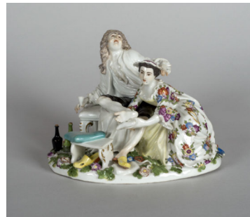
Abb. 42: Johann Joachim Kaendler: Porzellanfigur eines Gichtkranken, 1745–1750, Meissener Porzellan, Höhe 19,4cm, Wadsworth Atheneum Museum of Art, Hartford Connecticut.

Wadsworth Atheneum Museum of Art, Hartford Connecticut: 1917.1431.