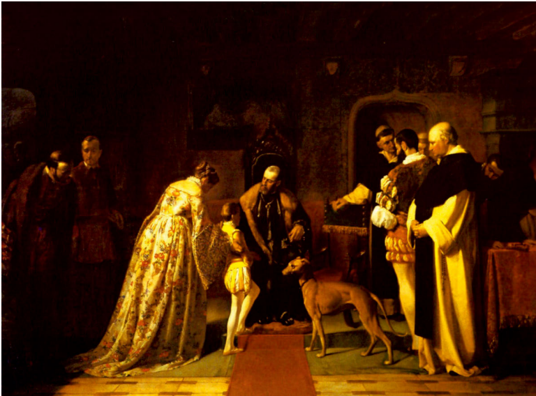
Abb. 38: Benito Mercadé y Fábregas: Carlos V en el Monasterio de Yuste , Öl auf Leinwand, 121 x 160cm, Patrimonio Nacional, Palacio de Riofrío, Segovia.

Patrimonio Nacional. Palacio de Riofrío Segovia.