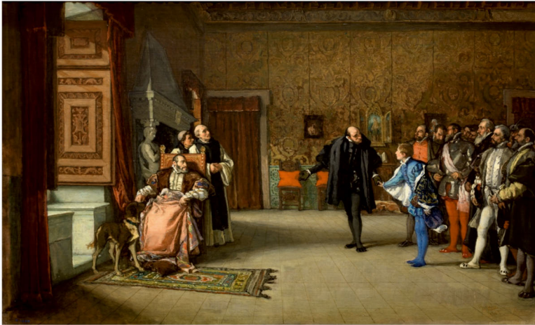
Abb. 35: Eduardo Rosales Gallinas: Presentación de Juan de Austria al emperador Carlos V, en Yuste, 1869 , Öl auf Leinwand, 76,5 x 123,5 cm, Museo del Prado, Madrid.

Distinktionsmerkmal in den Kanon adelnder Männlichkeitsattribute einordnen, wie im Folgenden gezeigt wird.