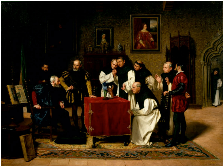
Abb. 37: Miguel Jadrque y Sánchez Ocaña: Carlos V en Yuste , Öl auf Leinwand, 147 x 193cm, Museo del Prado, Madrid.

so weit, Karl V. in einer Sänfte abzubilden (Abb. 36). In einem Werk Miguel Jadrques (1840–1919) von 1877, welches ebenfalls den König in Yuste zeigt, stellt der Künstler die Krankheit weitaus zurückgenommener dar (Abb. 37). Hier lagern die königlichen Füße lediglich auf einem dunklen Kissen am Boden. Ein Gemälde von Benito Mercadé y Fábregas (1821–1897), das die gleiche Szene wie bei Rosales jedoch gänzlich ohne Krankheitsanzeichen zeigt, wurde noch im Jahr seiner Ausstellung 1862 von Königin Isabella II. (1830–1904) gekauft (Abb. 38). 43