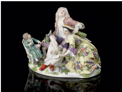
Abb. 41: Johann Joachim Kaendler: Der Gichtleidende, 1731–1770, um 1745(?), o.M. Science Museum, London.

Board of Trustees of the Science Museum/ Science & Society Picture Library: A641077. All rights reserved.