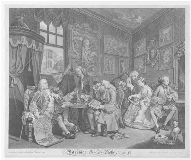
Metropolitan Museum of Art, New York. Harris Brisbane Dick Fund: 32.35(8).

Aus diesen Geldnöten resultiert der Wunsch des Earls, seinen Sohn mit der Tochter eines reichen Kaufmanns zu verheiraten. Der Brautvater, der wiederum seine Tochter für den höheren gesellschaftlichen Rang in die Ehe gibt, 108 sitzt weiter rechts im Bild, dem Earl am Tisch gegenüber. Auf diesem sind bereits Münzen aufgehäuft und der Vater der Braut hält den Ehevertrag in den Händen. 109 Die zukünftigen Eheleute könnten nicht weniger aneinander interessiert sein: Einander die Rücken zuwendend, sitzen sie rechts im Bild. Die Kaufmannstochter spielt mit dem Ehering, der auf ein Tuch aufgezogen ist, während sie den Einflüsterungen des Anwalts Silvertongue zuhört. 110 Der Viscount Squanderfield betrachtet sich geistesabwesend in einem Spiegel und greift zu einer Dose Schnupftabak. Diese weist, genau wie seine lächerliche,