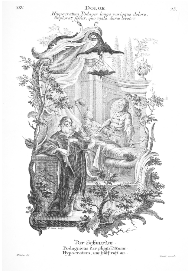
Abb. 34: Gottfried Eichler d. J. (Entw.) und Jakob Wangner (Ausf.): Dolor. In: Johann Georg Hertel: Pars I. des berühmten italiänische[n] Ritters Caesaris Ripae, allerley Künsten und Wissenschaften dienlicher Simbildern und Gedancken: welchen jedesmahlen eine hierzu taugliche Historia oder Gleichnis beygefüget. Augsburg 1758, S. 60, Kupferstich, 192 x 129mm, Getty Research Institute, Los Angeles.

Getty Research Institute, Los Angeles (93-B7426).