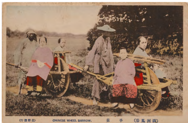
Abb. 5 Postkarte, um 1900, Privatsammlung