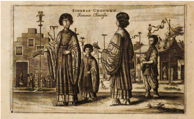
Abb. 4 Joan Nieuhof: Chinesische Frauen, in: Die Gesandtschaft der Ost-Indischen Gesellschaft in den Vereinigten Niederländern , Amsterdam 1666, 288

stereotyp gekennzeichnet durch Kindlichkeit, Gehorsam, Grausamkeit und Falschheit sowie Geduld und Fleiß. 29 Symbolisch musste der Körper der Frau für die jeweiligen Bilder herhalten: Sämtliche Begriffe finden sich auch im Zusammenhang mit dem Füßebinden, denkbar scheinbar nur in einem in Ritualen und kindlichem Gehorsam erstarrten Land, das Wachstum und Entwicklung verneint. 30 Die gebundenen Füße erschienen vor diesem Hintergrund gleichsam selbst wie mit Seide umwundene, zur Immobilität verdamnte Mumien. 31