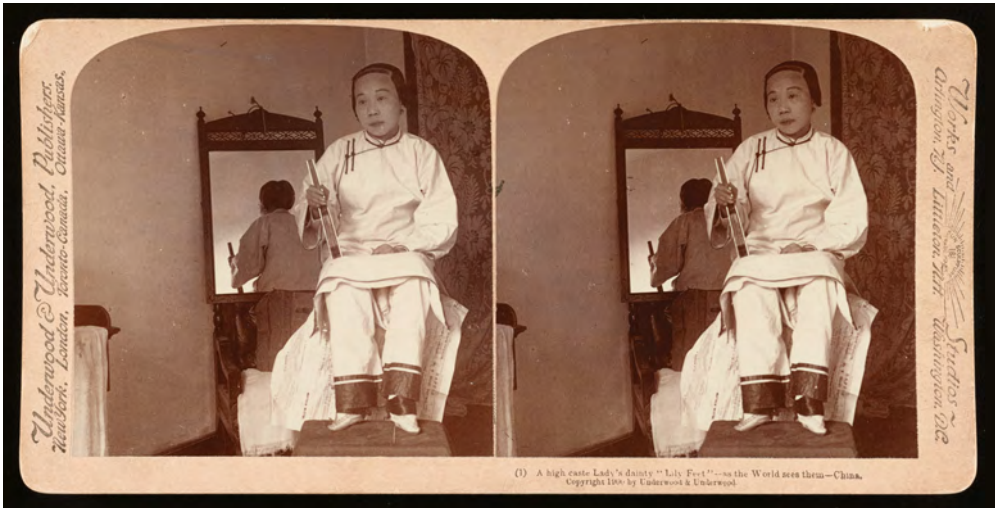
Abb. 2 James Ricalton: A high caste lady's dainty 'lily feet' – as the world sees them – China, 1900, Stereoskopie Washington, Library of Congress

Studio entstanden drei später weit vermarktete Aufnahmen: ein Porträt der sitzenden Frau mit Lotoschuhen „as the world sees them“ (Abb. 2), eine Aufnahme der Frau mit in Richtung der Kamera ausgestreckten Fußsohlen und eine Nahaufnahme der nackten Füße, deren Kleinheit durch den Vergleich mit dem Fuß einer „working woman“ demonstriert wird. 8 Solche Gegenüberstellungen wurden über Postkarten sehr populär und gerne auch in wissenschaftlichen Publikationen verwendet. 9