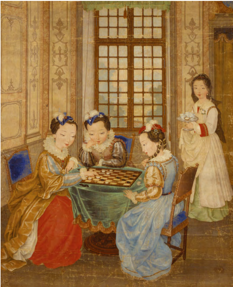
Drei Hofdamen beim Damespiel in den europäischen Räumen des Sommerpalasts Yuanmingyuan, Künstler:in nicht dokumentiert, China, 2. Hälfte 18. Jh., 130 x 109,5 cm, MARKK A 4535, möglicherweise Plünderware

Dass es im 18. Jahrhundert nicht nur eine europäische Chinamode gab, sondern auch eine chinesische Europamode, zeigt die Darstellung dreier Hofdamen in westlicher Robe beim Damespiel im Alten Sommerpalast in Beijing. Nicht nur Gewänder und Raumausstattung, auch Bildsprache und Körperdarstellung folgen europäischen Vorbildern.