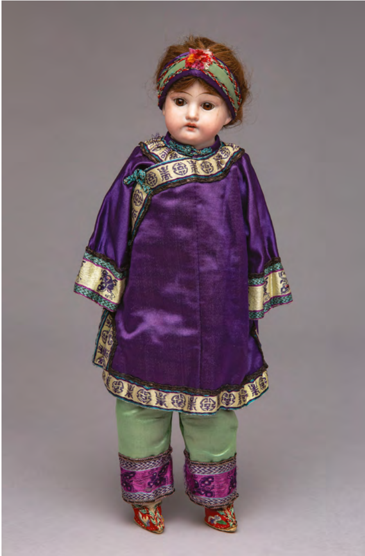
Puppe, Deutschland, Anfang 20. Jh., Porzellan, Glasaugen, Echthaar, Textil, 39 x 16 cm, MARKK 3707:07, Provenienz Siemssen

Der Kopf dieser Schlafpuppe aus Biskuitporzellan trägt die Ende des 19. Jahrhunderts eingeführte Kennzeichnung „Made in Germany“. Aufwändige Seidenkleidung und rote Lotoschuhe hingegen kennzeichnen die Puppe als Chinesin. Möglicherweise haben die Kinder der Familie Siemssen, die in Kanton ein Handelshaus betrieb, mit der Puppe gespielt.