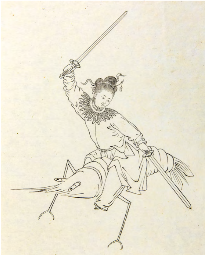
Tingqua 庭呱: Kämpferin auf einer Krabbe, China, Qing-Dynastie, Tusche auf Papier, 31 x 31 cm, MARKK xx soas 454

Dass gebundene Füße nicht grundsätzlich mit Häuslichkeit assoziiert wurden, zeigen diverse Darstellungen von Kämpferinnen wie diese Sallengestalt aus dem Gefolge der „Weißen Schlange“. Die Weiße Schlange ist ein daoistischer Praktiker, der sich in eine Frau verwandelt, um seinen Wohltäter aus einer früheren Existenz glücklich zu machen. Er:sie wird jedoch wegen seiner:ihrer magischen Eigenschaften abgelehnt und löst auf dem Höhepunkt der Geschichte mithilfe eines Krabbenheeres eine gewaltige Flutwelle aus. Die Geschichte ist in China außerordentlich populär und wird heute in Taiwan bei Prozessionen zu Ehren von Mazu 媽祖, der Göttin der Seefahrt, auf Festwagen dargestellt. 1 Ent-