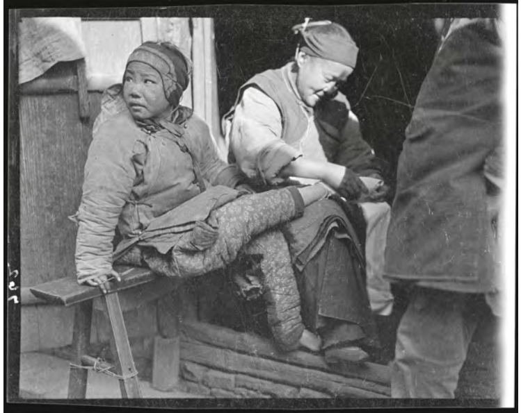
Abb. 3 Sidney D. Gamble: Straßenszene in Shiling, 1919, Schwarzweißfotografie, Duke University Repository

letzten Kaiser der Südlichen Tang-Dynastie (10. Jh.), auf einer goldenen Lotosblume zu tanzen. Einer anderen Erzählung zufolge imitierten Hofdamen die ungewöhnlich zierlichen Füße einer Kaiserin und wurden dann selbst wieder imitiert; eine dritte behauptet im Gegenteil, die Kaiserin habe einen Klumpfuß gehabt, weswegen die Hofdamen angehalten wurden, ihre Füße ebenfalls zu umwickeln, um sie nicht zu beschämen. Eine vierte Legende erzählt von einer Fuchsfée, die auf die Erde gesandt wurde, um in Gestalt einer schönen Frau einen korrupten Herrscher zu verführen und zu stürzen – ihr Körper verwandelt sich bis auf die Pfoten, die sie hinter den Binden versteckt. Die Faszination für kleine Füße zeigt sich schon in der frühesten bekannten Version von Aschenputtel, Yexian 葉限, die Mitte des 9. Jahrhunderts zum ersten Mal schriftlich festgehalten wurde. 16