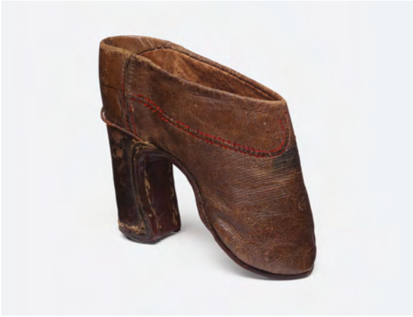
Abb. 6 Überschuh aus Leder, Hersteller:in nicht dokumentiert, China, späte Qing-Dynastie, Leder, Eisen, Deutsches Ledermuseum, Offenbach

rückschleuderte. 38 Neben Fotos von arbeitenden Frauen gibt es auch materielle Belege für die Mobilität der Frauen, etwa stark beanspruchte Überschuhe aus Leder (Abb. 6). 39