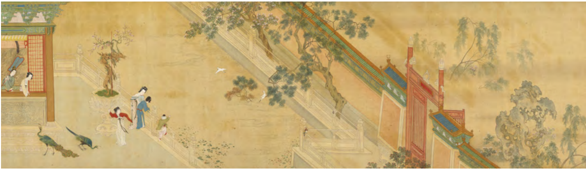
Qiu Ying 仇英 (ca. 1494–1552): Frühlingsmorgen im Han-Palast, China, Ming-Dynastie, Querrolle, Tusche und Farben auf Seide, 30 x 574 cm, Palastmuseum Taipeh