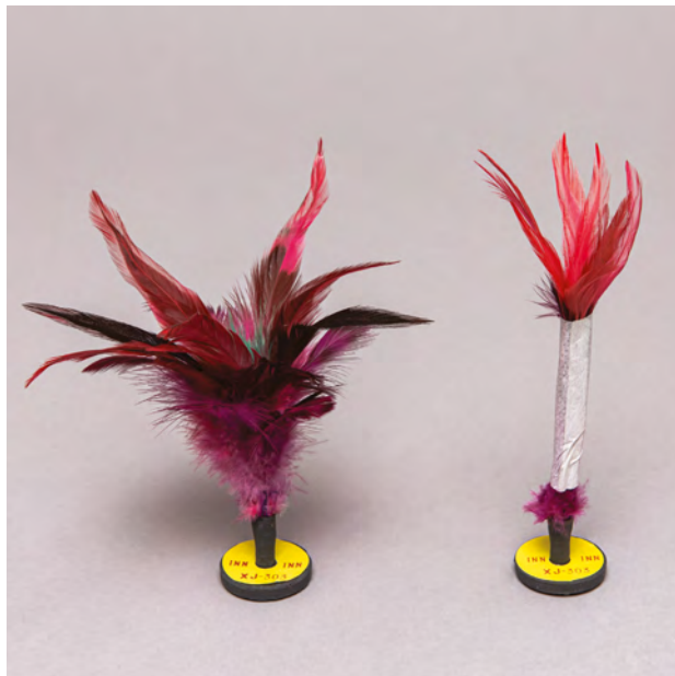
Federfußbälle, Fa. INN, Deutschland, 1990er Jahre, Federn, Gummi, 13,5 x 13 cm, 15 x 6 cm, MARKK 95.64:2

Chinesinnen fanden zahlreiche Spiele und Sportarten, die auch mit gebundenen Füßen möglich waren. Dazu gehört das Kickfederballspiel ( ti jianzi 踢毽子), das sich vermutlich aus der Urform des Fußball ( cuju 蹴鞠) entwickelte und nicht zuletzt dem militärischen Training diente. 1 Besonders in der Tang-Zeit (618–907) mehren sich Berichte über Fußball spielende Hofdamen. In einem Gedicht von Li Yu 李漁 (1610–1680) findet sich ein expliziter Hinweis auf die „winzigen Füßchen“ der bewunderten ‚Fußballerinnen‘, die vermutlich mit einem Lederball spielten. 2 Kickfederballwettbewerbe fanden vor allem zu Neujahr statt.