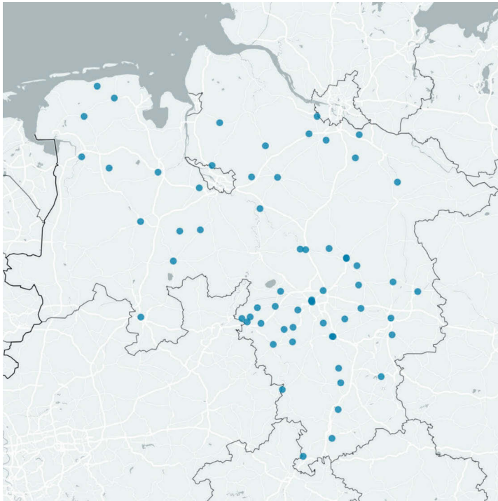
Abbildung 8: Protestaufrufe zu Post-Corona-Protesten in Niedersachsen im Herbst 2023 (vgl. Kapitel 4)