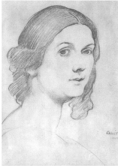
Abb. 1 Isadora Duncan 1908 »zurück in die Zukunft« blickend, portraitiert von dem russischen Bühnen- und Kostümbildner Léon Bakst. (Puschkin Museum für bildende Künste, Moskau)