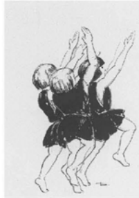
Abb. 11 Duncanschülerinnen karikiert von Dani. (Bachrušin Theatermuseum, Moskau)

sowjetischen Trend der Zeit: 52 » [...] personally, I would have preferred boys, for they are better able to express the heroism of which we have so much need in this age.« 53