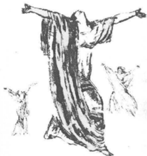
Abb. 10 Eine Zeichnung von Léon Bakst zeigt Duncan zur Revolutionshymne tanzend. (T. Kasatkina: Ajsedora, S. 102)

Lenin soll bei Duncans Auftritt persönlich anwesend gewesen sein und diesen ausgiebig beklatscht haben. 31 Glaubt man den Quellen, dann stellte das Programm ein Wagnis dar, da Duncan als erste öffentlich zur offiziellen Hymne der Revolution tanzte. Später wurden Tänze zu Revolutionsliedern als sogenannte »Revolutionstänze« fester Bestandteil der sowjetischen Feste. 32