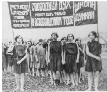
Abb. 12 Abschluss und Beginn der Übungen bestand in einem gemeinsamen Marsch.