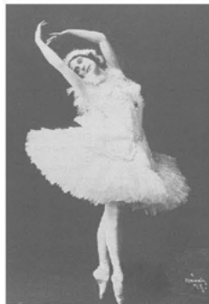
Abb. 5 Anna Pavlova ca. 1908 im »Sterbenden Schwan«.