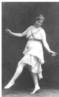
Abb. 3 Duncan 1903 in einer Pose aus »Narziss«, Chopin op. 64, Nr. 2. (D. Duncan: Life into Art, S. 68)

Hatten bis 1899 noch rosa Strumpfhosen und Tanzschlappchen Isadora Duncans Beine geziert, so waren Beine und Füße jetzt nackt. Ihre Arme waren unverhüllt, der Körper vom Korsett befreit. Doch sie hatte nicht alle Hüllen fallen lassen. Eine leichte Tunika umgab noch ihren bloßen Körper. 1