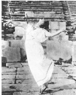
Abb. 8 Duncan 1903 im Theater des Dionysos. (D. Duncan: Life into Art , S. 57)

Duncan war ganz im Trend der Zeit, wenn sie die Zukunft im antiken Griechenland sah. Um sie in ihren Tänzen zur Erscheinung zu bringen, nahm sie Abbildungen rasender Mänaden auf antiken Vasen zum Vorbild. Und das Ergebnis ließ sich sehen.