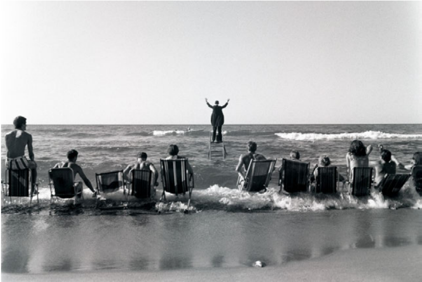
Abb. 1: Eustachy Kossakowski, Tadeusz Kantor, Panoramic Sea Happening , Łazy 1967

ihren Liegestühlen aufspringen, sehen wir den befrackten Künstler, wie er stoisch sein unberechenbares Orchester leitet. Seine fortlaufenden Gebärden, mit denen er Takt und Dynamik des Wellengangs dirigiert, erinnern angesichts der steigenden Flut an jenen »großen Abstand zwischen der überragenden Situation und dem winzigen Helden«, den Gilles Deleuze als kennzeichnend für die Slapstick-Komödie Keatons ansah. 3