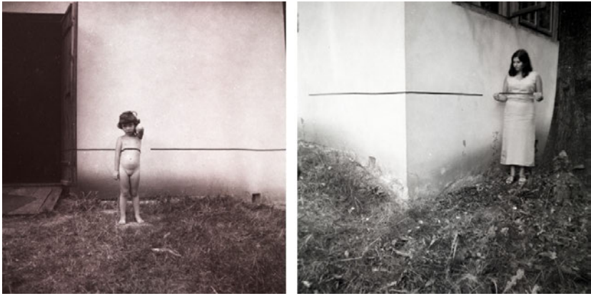
Abb. 3a&b: Eustachy Kossakowski, Edward Krasinski, Intervention , Zalesie 1968

Fotoserie Perspective Corrections (1967–69) oder Richard Serra in seinem 16mm Film Frame (1969), scheint es Krasinski und Kossakowski gleichwohl weniger darum zu gehen, auf die Verzerrungen des Raumes im optischen System des technischen Bildes aufmerksam zu machen. 22 Vielmehr wird ihnen die Fotokamera zu einem Werkzeug, das es erlaubt, die Potenziale der räumlichen Desorientierung durch den Streifen auszuloten. Klebeband und Kamera bilden eine Art experimentelles Dispositiv, mithilfe dessen Künstler und Fotograf erforschen, wie sie in die Ordnung des Raumes eingreifen können.