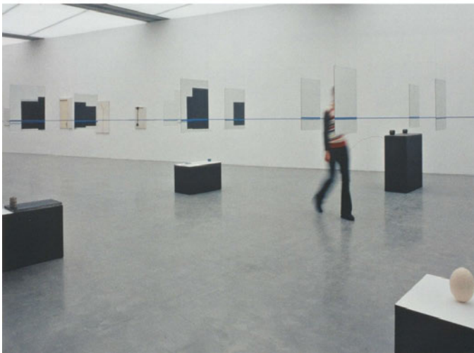
Abb. 6a&b: a) Ausstellungsansicht Edward Krasiński, Intervention, Tate Modern (Galerie Klosterfelde Berlin 2001) ; b) Ausstellungsansicht Edward Krasiński. Les mises en scène, Generali Foundation, Wien, 2006