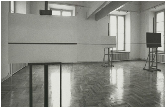
Abb. 5: Ausstellungsansicht Edward Krasiński, Intervention Galeria Appen-dix, Warschau 1991

die blauen Streifen, die zwischen Wänden, Fenstern und Bildtafeln vor und zurück weichen, springen in ein und dieselbe Ebene, um sich wie Perlen auf einer Kette aneinander zu reihen (Abb. 5). Die Abstände ihrer Träger ebenso ignorierend wie die Ecken und Nischen der Galerie, verbinden sie sich im Auge zu einer fortlaufenden, glatten Linie, welche die gesamte Topographie des Raumes hinter sich lässt. 39 Denn als Horizont betrachtet, das heißt: auf Augenhöhe, durchzieht der blaue Streifen wie ein Sprung den Galerieraum, um dessen Kerbungen einzuebnen und ihn auf jene flache Weite hin zu öffnen, deren Darstellung die Bildtafeln allein verweigern: eine virtuelle Landschaft – poem to the sea?