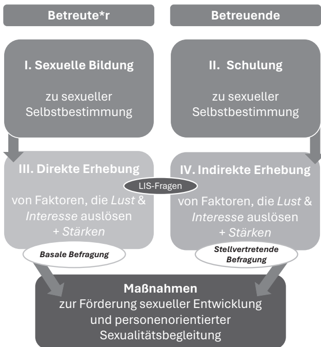
Abb. 1: Übersicht LIS-Konzept, Westphal

Im Folgenden wird das jeweilige Vorgehen der Handlungsebenen kurz erläutert.