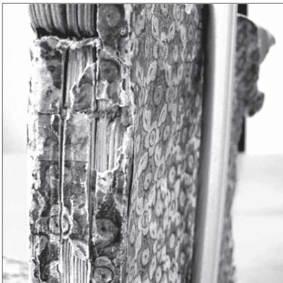
Raccolta di scritti sulla China