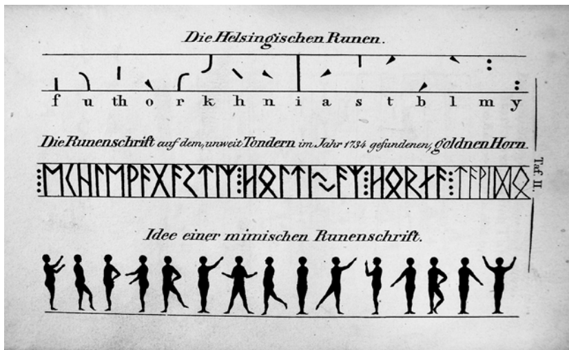
Abb. 1: Idee einer mimischen Runenschrift (Legis 1829: Tafel II c).

Tanz und Schrift sind auf vielfache Weise miteinander verbunden und finden in Stéphane Mallarmés Begriff der écriture corporelle ihre prägendste Denkfigur. Tanzen wird hier als körperliches Schreiben und bewegte Schrift konzipiert, eine Idee, die die Theorie und Praxis von Tanz bis in die Gegenwart hinein beeinflusst (Schwan 2019a). Innerhalb dieses weiten Beziehungsfeldes lauert jedoch ein dunkles historisches Phänomen, das bis heute keine tanzwissenschaftliche Kritik erfahren hat, für die Ideengeschichte von Tanz als écriture corporelle aber entscheidend ist, werden doch hier mögliche Aporien in der Analogisierung von Tänzen und Schreiben deutlich. Vor allem die vorschnelle und unreflektierte Ritualisierung von Tanz als Schrift und die damit verbundene quasi-religiöse Aufladung der écriture corporelle zeigen sich hier in ihrer komplexen Problematik (Schwan 2019b).