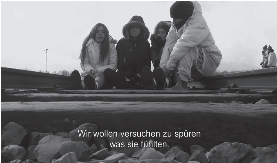
Abb. 1: Die Szene aus dem Dokumentarfilm zeigt israelische Jugendliche in einem ehemaligen polnischen Konzentrationslager bei ihrem Versuch, das Leiden ihrer Vorfahren nachzuempfinden.

Bei „#uploading_holocaust“ spielen weniger Fakten und historisches Wissen um die Judenvernichtung eine Rolle, wie man bei einem Bildungsprojekt zunächst vermuten würde, sondern vielmehr Emotionen. Warum?