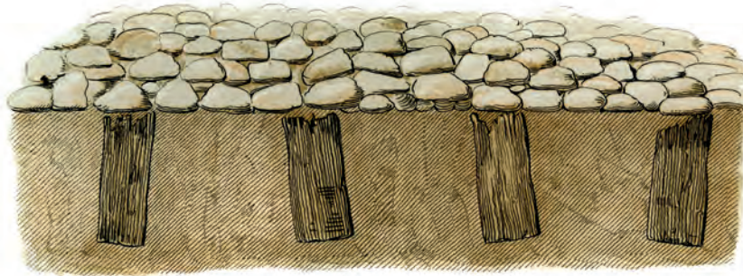
Gjennemsnit med de under Kampesteensmuren staaende Egeplanker Vest for Skandsen N o 14.