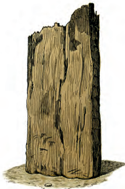
Egeplanke, 4 Fod lang, 4 Fod 5 Tom. bred og 5 Tom. tyk, funden under Kampesteensmuren Vest for Skandsen N o 14.