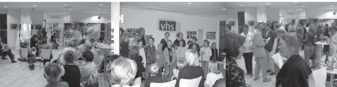
„Schnittstelle Kunst – Vermittlung“ in der Kunstschule IKARUS: Öffentliche Situationen

Bei der Aktion selbst kam die Frage auf: Welche Kompetenzen hat die künstlerische Leitung, welche die Leitung der Kunstschule? Zeitweise griffen Aktionen