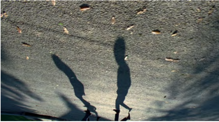
Abb. 259: THE TREE OF LIFE (2011). Terrence Malick, K: Emmanuel Lubezki