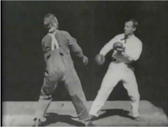
Abb. 258: THE GLENROY BROTHERS (1894). William K. L. Dickson, William Heise

Mit der Elektrifizierung der Studios und Dreharbeiten (um 1904, verstärkt ab 1907) 17 erweitert und intensiviert sich das Repertoire filmischer Beleuchtungs-dramaturgie; Schatten und Nacht werden nun systematisch gestalt- und einsetzbar und gewinnen eine eigene, oft ins Unheimliche spielende Eigenständigkeit, mit der das Kino an die Tradition der Laterna magica und des asiatischen Schattentheaters anschließt und diese in eine autonome filmische Kunstform überführt. 18 In Filmen wie Robert Wiens DAS CABINET DES DR. CALIGARI (1920) und F. W. Murnaus NOSFERATU – EINE SYMPHONIE DES GRAUENS (1922) führen die Schatten, diese »Phantome der Nacht«, 19 im Sinne einer Formulierung von Gilles Deleuze ein »nichtorganisches Leben«. 20 So auch in C. T. Dreyers VAMPYR – DER TRAUM DES ALLAN GRAY (1932), in dem in einer Reihe von Szenen gänzlich autonome Schatten die sicher geglaubte Abgrenzung zwischen