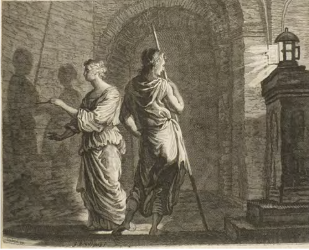
Abb. 260: Johann Jacob von Sandrart, Die Tochter des Töpfers Butades zeichnet ihren Geliebten . Kupferstich, aus: J. J. von Sandrart, Teutsche Academie der Bau-, Bild- und Mahlerey-Künste , Bd. II, Nürnberg 1675, Vorrede (nach S. 2), Tafel B, unten