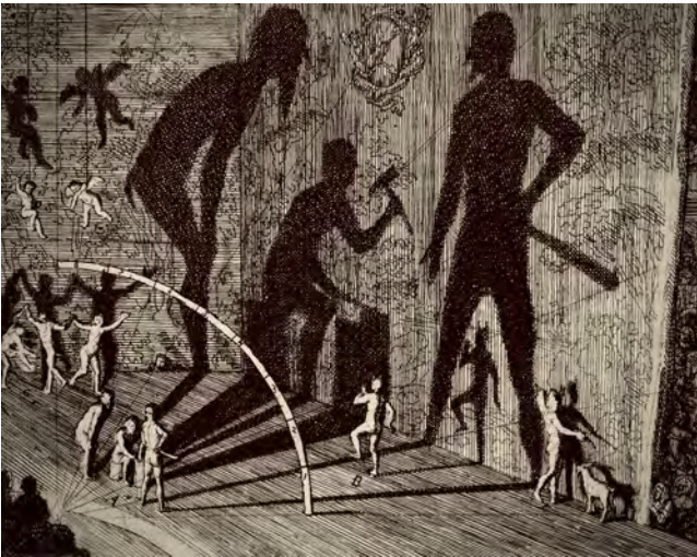
Abb. 261: Samuel van Hoogstraten, Schattentheater . Radierung, aus: Samuel van Hoogstraten, Inleyding tot de Hooge Schoole der Schilderkonst , Rotterdam 1678, S. 260