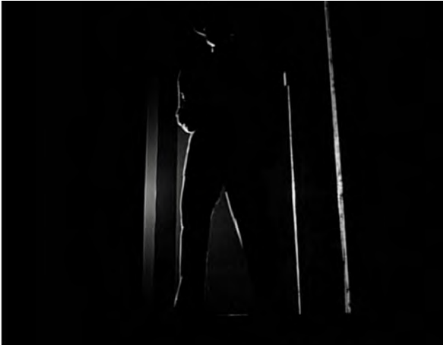
Abb. 262: T-MEN (1947), Anthony Mann, K: John Alton