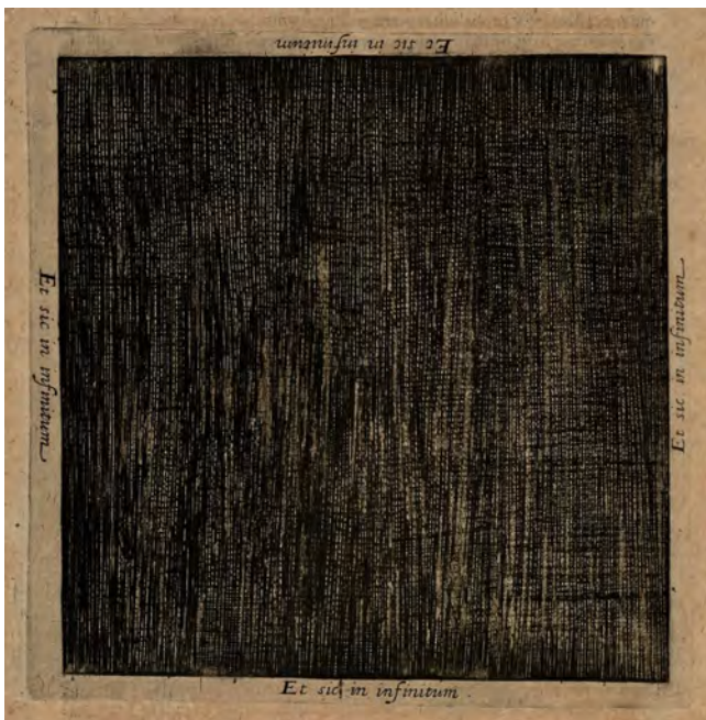
Abb. 263: Matthäus Merian d. Ä., Hyle: Die Ursubstanz der Schöpfung (nach einem Entwurf von Robert Fludd). Radierung, aus: Robert Fludd, Utriusque Cosmi, Maioris scilicet et Minoris, Metaphysica, Physica atque Technica Historia , Bd. I, Oppenheim 1617, S. 26