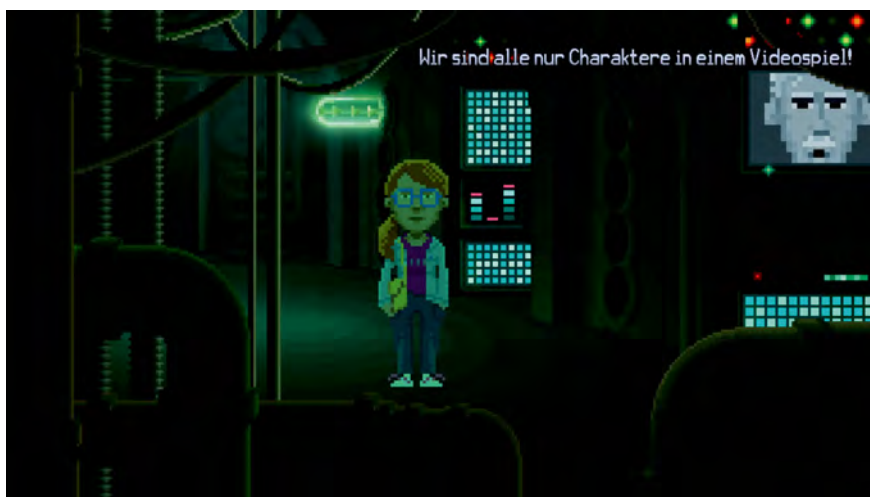
Abb. 1: Mosaikästhetik und anachronistischer Pixelstil in »Thimbleweed Park«

Vorgänger, parodiert aber auch weitere transmediale Genres wie etwa den Film Noir. Zunächst als Detektivgeschichte angelegt, entdecken die Protagonistinnen und Protagonisten von »Thimbleweed Park« im Spielverlauf, dass die mysteriösen Todesfälle in der gleichnamigen Kleinstadt Thimbleweed Park Teil einer umfassenden Verschwörung sind. Ihre Ermittlungen führen sie schließlich in eine stillgelegte Kissenfabrik, in der sie den vermeintlich verstorbenen Fabrikbesitzer Chuck als digitale Projektion auffinden. Chuck war es nämlich vor seinem Tod gelungen, seinen Geist in einen Computer hochzuladen. Chuck offenbart seiner Nichte Delores, dass die Stadt eine Computersimulation und ihre Bewohner damit lediglich Figuren in einem Computerspiel sind. Delores entschließt sich daraufhin, den Computer herunterzufahren und löscht damit die Spielwelt und alle Figuren, also auch sich selbst.