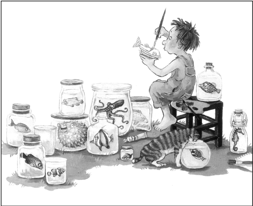
Abb. 3 aus Annette Swoboda: Der kleine Gott und die Tiere . Hamburg 2008.

sich die kindliche Protagonistin per Walkie-Talkie mit ihren Sorgen an Gott – und erhält tatsächlich Antwort von einer brummigen Männerstimme. Sie stellt fest, dass Gottes Stimme zu einem älteren Mann mit Alkoholfahne gehört, der im selben Haus wie sie wohnt. Obwohl er seinen weinseligen Scherz bald bereut, bleibt ihm nichts anderes übrig, als sich auf die Fragen der Kleinen einzulassen. Doch allen Schwierigkeiten zum Trotz: Karo stellt fest, dass seine Göttlichkeit weniger in seiner Allmacht liegt als in der Bereitschaft, sich mit ihr und ihren Problemen zu beschäftigen. 11