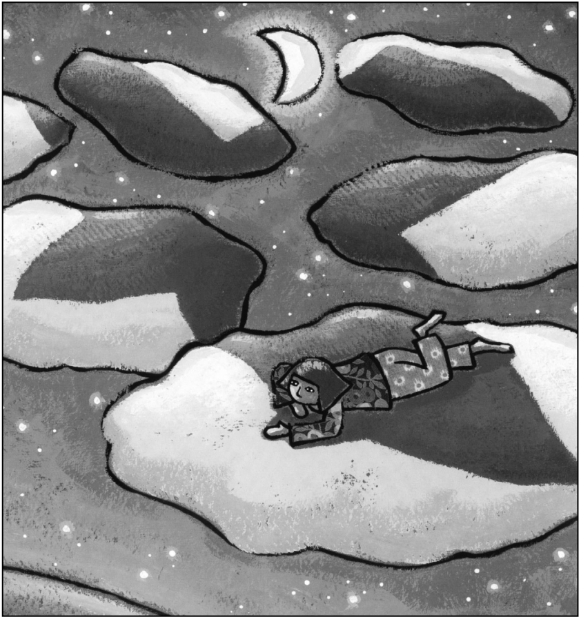
Abb. 4 aus Regine Schindler: Im Schatten deiner Flügel. Psalmen für Kinder . Illustriert von Arno. Düsseldorf 2005.

sprünglich gesungenen Texte der Psalmen lassen sich als eine Art „Gebetsformular“ in jede Zeit und damit auch in den heutigen Kinderalltag übertragen. Während in den üblichen Kinderbibeln die Psalmen oft ausgespart werden, hat Regine Schindler unter dem Titel „Im Schatten deiner Flügel“ 15 ein Psalmenbuch für Kinder herausgegeben. Die bildhafte, anschauliche Sprache dieser Texte bietet vielerlei Möglichkeiten, eigene Gottesbilder zu finden oder neue Gottesbegriffe kennen zu lernen, Dinge in Worte gefasst zu finden, die man selbst