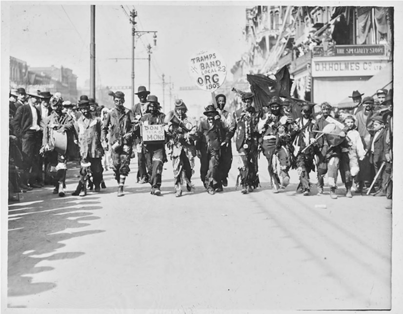
Abb. 41. Tramps, Mardi Gras, New Orleans, 1907. The Historical New Orleans Collection (THNOC 1981.261.58, 12.2.1907).

Maske der Prekarisierten vorgeführt und mit der von Mbembe so genannten modernen conditio nigra 447 der zu Unpersonen Gemachten verknüpft. Auf einem Pappschild, das davor warnt, den Affen zu provozieren, wird Blackface wiederum mit dem Zoomorphen in Verbindung gebracht und der zeitgenössische Darstellungs Rassismus aufgerufen. Die schief aufgesetzten Hüte, die abgerissenen Anzüge und die zu Instrumenten zweckentfremdeten Metallimer dieser vier Jahre zuvor gegründeten Band, so heißt es jedenfalls auf einem mitgebrachten Schild, deuten ebenfalls auf Minstrel Shows hin. JIM CROW ist hier gewissermaßen als Personifikation der inzwischen unter seinem Namen firmierenden Verhältnisse zitiert und als maskulinistische Meutenfigur ausge-