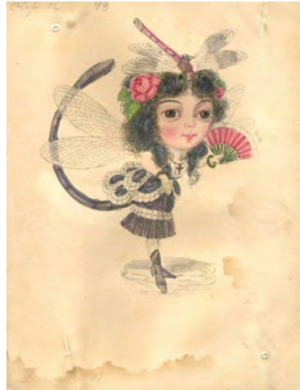
Abb. 40. Demoiselle Fly, Wasserzeichnung für die Mistick Krewe of Comus Parade 1873, New Orleans, Charles Briton. Tulane University, Carnival Collection.

Mehr als hundert Jahre später, zu Beginn der 1990er-Jahre, werden die berüchtigten Darstellungen noch einmal aufgegriffen. Nun zeugen sie vom Bedürfnis, die apartheidähnlichen Jim Crow-Verhältnisse im Karneval nachleben zu lassen. Bevor Comus, Momus und Proteus ihre Paraden aus Protest gegen eine neue Verwaltungsvorschrift zur überfälligen Desegregation aller öffentlich auftretenden, von der Stadt infrastrukturell unterstützten Karnevalsorganisationen einstellen und sich auf geschlossene By-invitation-only-Bälle konzentrieren, werden die Figuren von 1873 bei einer letzten Parade noch einmal zitiert. 440