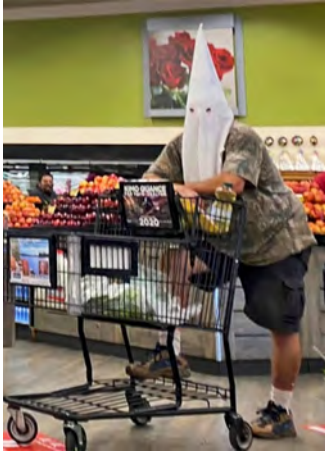
Abb. 34. Supermarkt, San Diego, Kalifornien, Social Media Post, 2020 (Screenshot).

codierten historischen Pullback. 392 Diese karnevaleske Verwirrung der Referenzen steht im Kontext eines global zu verzeichnenden rechten Backlashs, der unter anderem ›queerer Wokeness‹ in einem merkwürdigen Rollentausch den Part der Polizei zuschreibt. Zugleich deutet die von rechts angeeignete Transgression auf die Metamorphose neoliberalisierter Verhältnisse in illiberale Regierungsformen voraus.