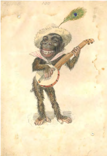
Abb. 39. Gorilla or The Missing Link, Wasserzeichnung für die Mistick Krewe of Comus Parade 1873, New Orleans, Charles Briton. Tulane University, Carnival Collection.

dazu auf, die Regierung nach der Abolition wieder zu stürzen. 439 Dieser Karneval hat also eine dezidiert politische Funktion.