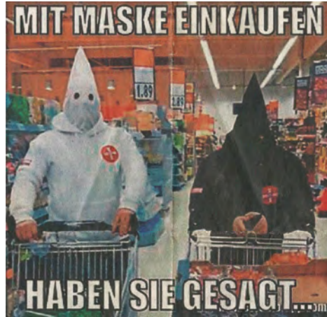
Abb. 35. Supermarkt, Hillenburg, Südthüringen, Social Media Post, 2020 (Screenshot).

Das zunächst gegen die Coronaregularien eingesetzte ›Dragging‹, das Mitschleppen rassistischen Terrors im Bildzitat, zeugt von der ambivalenten Mobilisierbarkeit performativer Kulturtechniken. Demonstriert wird in diesem Fall, wie sich das medizinische Maskengebot ›metapolitisch‹ übererfüllen lässt. Dieser rechte performative Ausnahmezustand in Drag zielt gerade nicht auf ein universales »Lachen des ganzen Volks«, 393 wie Michail Bachtin den zeitlich begrenzten, die Verhältnisse zumindest potenziell umkrempehenden mittelalterlichen europäischen Karneval umschreibt und damit in Reaktion auf den Stalinismus retrospektiv vielleicht allzu sehr romantisiert. Das ›Klan-Dragging‹ ruft vielmehr dezidiert die Erinnerung an karnevalesk maskierte, rassistische Lynchspektakel