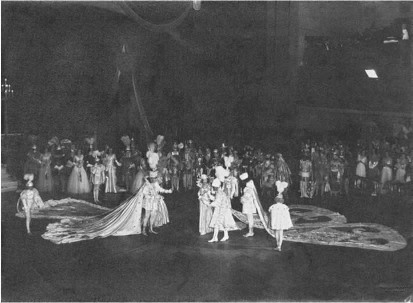
Abb. 38. »Meeting of the Courts«, Comus, Rex, Mardi Gras 1941, New Orleans.

Comus had gone by, with his train of mystic pageantry stretching far behind in glowing colors of many hues, and lit with the gleam of a thousand torches. (...) and from the throne room beyond the mystic curtain whisperings of the court drifted out to the waiting multitude. The ball, with its memories of many other Carnival balls, and with its associations of bravery and skill and of men who have gone forth to die for their country, was decked in the colors of the Carnival. 435