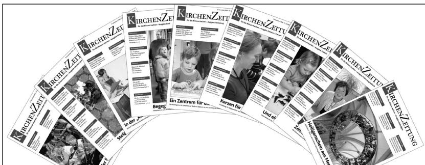
Abb. 2: Jede Nummer der Aachener Kirchenzeitung erscheint in neun regionalisierten Ausgaben (im Bild die Ausgabe 45 vom 9. November 2008).

dreifache höher ist, als dies bei den säkularen Tages- und Wochenzeitungen der Fall ist. Darüber hinaus genießt der Anzeigenteil der Kirchenzeitungen eine hohe Glaubwürdigkeit bei den Lesern. Zuvor konnte durch den nicht praktizierten regionalen Seitenwechsel nur sehr unterdurchschnittlich der lokale und regionale Werbemarkt bearbeitet werden. Verständlich – welcher regionale Inserent (z. B. ein ortsgebundener Handwerker) sollte in eine bistumsweit erscheinende Wochenzeitung inserieren? Hohe Streuverluste rechtfertigen keine Investition in teure Mediapreise.