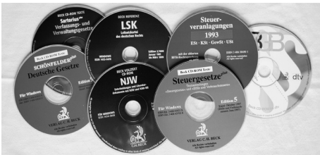
Beispiele der zweiten Generation von CD-ROMs für Windows.

vom Binden der Hefte von nun an abgesehen. Diese CD-ROMs und vor allem später