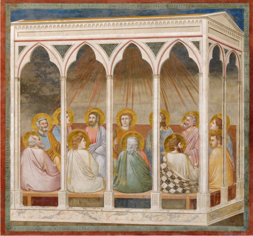
Abb. 7: Giotto di Bondone, Pfingsten (Pentecoste), ca. 1303–1305, Fresko, Cappella degli Scrovegni, Padua.

den willkürlichen Regungen Einzelner abhängt, sondern von einem nach höherer Vernunft organisierten Gerichtsverfahren.