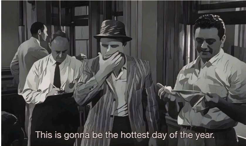
Abb. 3: Eintreffen der Geschworenen, stilisiertes Filmbild.

Im Katholizismus bezeichnet das Fegefeuer jenen mystischen Übergangsort zwischen Leben und Tod, wo die Seele gewogen wird und die Entscheidung fällt, ob sie in den Himmel oder in die Hölle kommt. Die Waage ist ebenso das Attribut der Göttin Justitia. Damit entwickelt sich die weitere Handlung im Geschworenenzimmer zu einer doppelten Urszene, nämlich im katholischen und im aufklärerischen Sinne. Atmosphärisch wird die Nähe zur Hölle noch vor Beginn der Debatte angezeigt: Bereits beim Eintreten wischen sich die Geschworenen den Schweiß vom Gesicht und ziehen zum Teil ihre Sakkos aus. Geschworener Nr. 7 versucht vergeblich den Ventilator anzuwerfen und hält dann vor aufgerissenem Fenster fest, dass dies laut Wetterbericht der „heißestes Tag des Jahres“ werde. Nachdem der Gerichtsdienstler den Raum versperrt, schreiten die Geschworenen rasch zu ihrer ersten Abstimmung im Konklave – in der Hoffnung, sich durch ein schnelles Urteil aus ihrer misslichen Lage zu befreien.