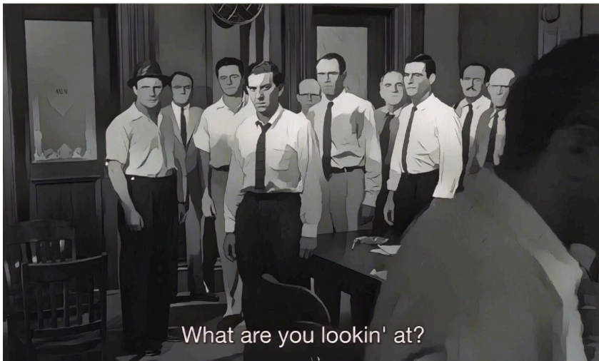
Abb. 5: Vereinter Aufstand gegen die Wut, stilisiertes Filmbild.

sanktioniert. Den Zuseher:innen wird hier jedenfalls zweifelsfrei verdeutlicht: Gewalt wird mit dem Ausschluss aus der Gemeinschaft bestraft; und zwar kompromisslos über alle sozialen Schichten, Generationen und Berufsstände hinweg.