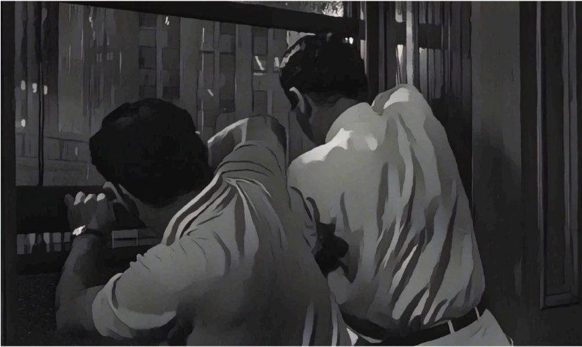
Abb. 6: Das Gewitter bricht sintflutartig los. Der Vorsitzende hilft Nr. 8 das verklemmte Fenster zu schließen; stilisiertes Filmbild.

Verdichtung christlicher Motive verstanden werden und markiert einen klaren Wendepunkt des Films. Metaphorisch klingt sowohl die Sintflut als auch Haydns Schöpfungsoratorium an, in dem Uriel, der Erzengel des Lichts, folgende Worte spricht: