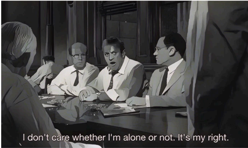
Abb. 8: Geschworener Nr. 3 bleibt als einziger bei seinem Votum „schuldig“, stilisiertes Filmbild.