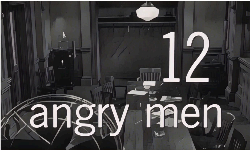
Abb. 2: Originaltitel „12 angry men“ vor dem Geschworenenzimmer, stilisiertes Filmbild.

Der Hauptteil der Handlung ereignet sich in einem kleinen Hinterzimmer des Gerichtsgebäudes, dem Jury Room bzw. Geschworenenzimmer. Auch wenn der Raum recht unscheinbar wirkt, muss betont werden, dass wir hier gewissermaßen ins Allerheiligste blicken. Normalerweise ist der Zutritt verboten, wenn die Geschworenen im Konklave verhandeln. Die Eröffnungsszene zeigt den Raum in der Vogelperspektive aus zirka zwei Meter Höhe. Die Kamera ist anfangs zentral auf eine Tafel mit Holzstühlen gerichtet, an der sogleich die zwölf Geschworenen Platz nehmen werden.