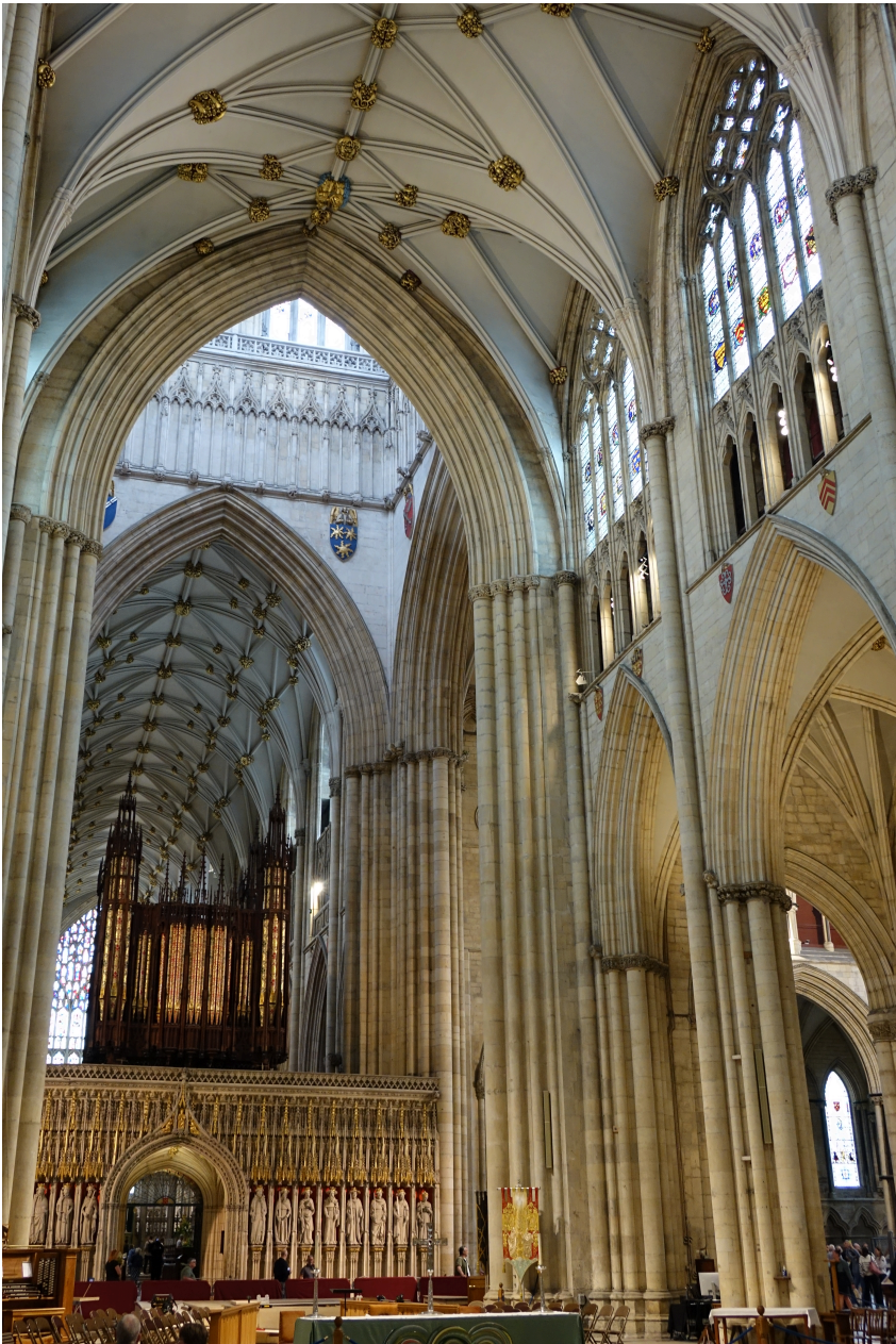
Abb. 8: Wappen im Langhaus und im Vierungsturm, Blick aus dem Schiff Richtung Vierung.