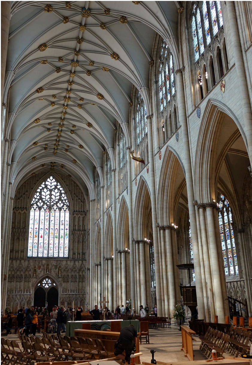
Abb. 3: Blick aus der Vierung ins Langhaus des Minsters, Schilde in den Zwickeln.