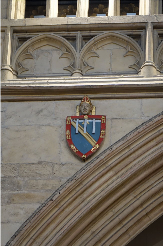
Abb. 1: Wappen des Erzbischofs Richard Scrope (1398–1405).

Inkludierung königlicher Insignia in ein Familienwappen im Gegenzug für Loyalität und Gefallen zu vergeben. 26