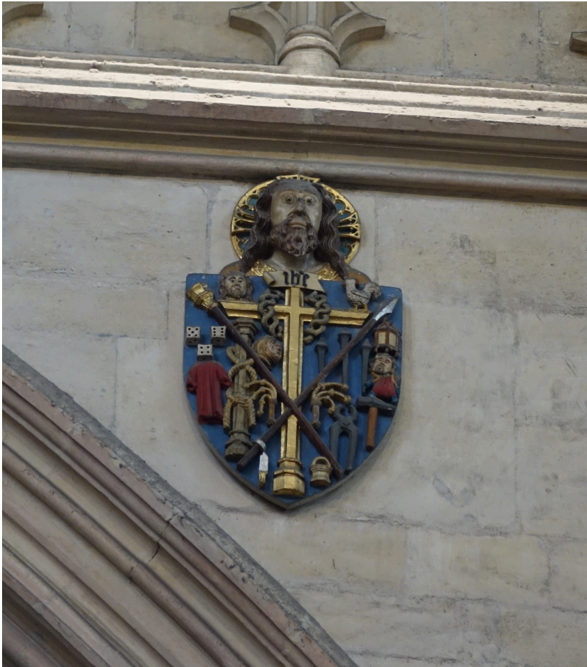
Abb. 11: Arma Christi im Chor.

vielleicht vor einem Kruzifix, sicherlich jedoch in Anwesenheit der Arma Christi statt. Dieses Privileg und die damit erhoffte Rettung aus dem Purgatorium waren nur denen reserviert, die den Chorraum betreten durften – oder durch ihren heraldischen Zweitkörper vertreten waren.