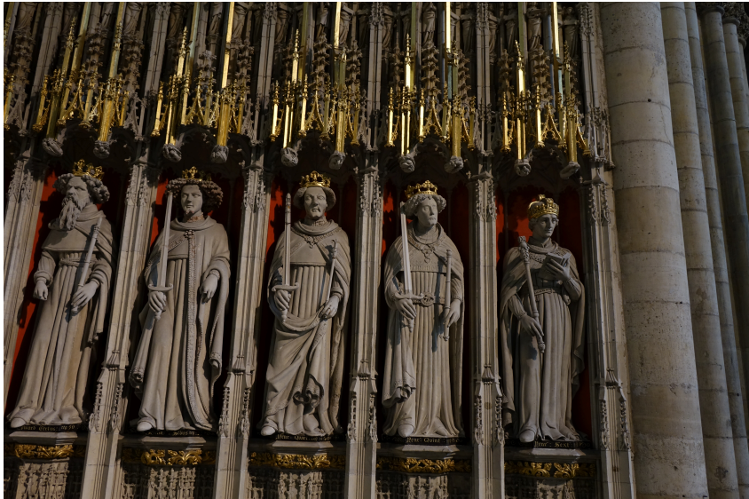
Abb. 7: Die fünf letzten Könige am Lettner: Eduard III., Richard II., Heinrich IV., Heinrich V. und Heinrich VI.