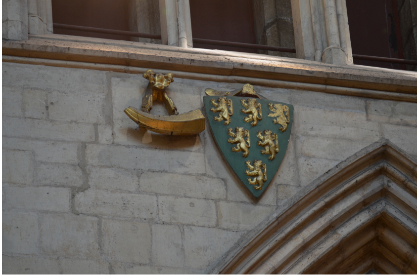
Abb. 4: Wappen und Horn Ulfs im Langhaus, © Meg Bernstein, reproduziert mit freundlicher Genehmigung des Chapter of York.

die Möglichkeit der englischen Ritter, durch Kriegshandlungen und Stiftungen Teil einer königlich-heraldischen Selbstdarstellung in der wichtigsten Diözese Nordenglands zu werden. Durch ihre heraldische Präsenz zeigten die Familien nicht nur ihren Status, sie betonten auch ihren territorialen Anspruch über die der Diözese verbundenen nördlichen Gebiete.