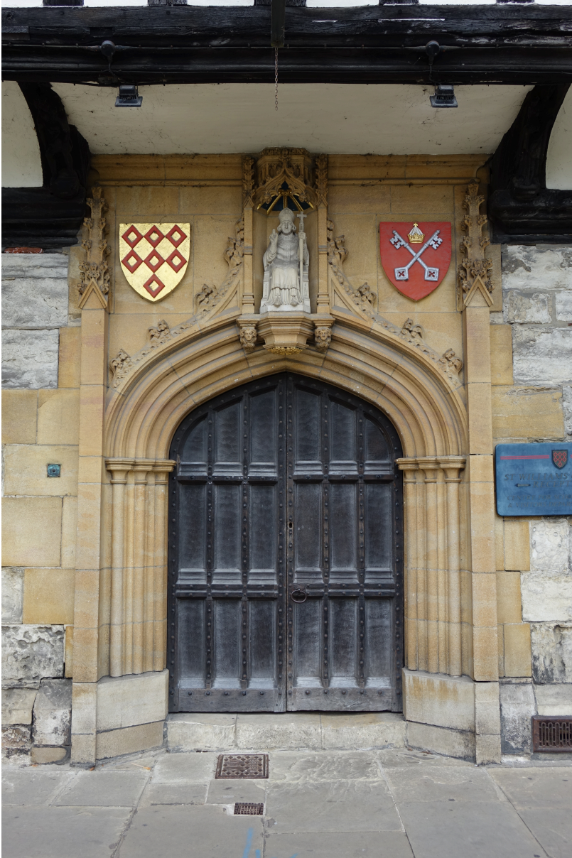
Abbildung 9: St. William's College, Wappen von St. William und Petrus über dem Eingangportal.