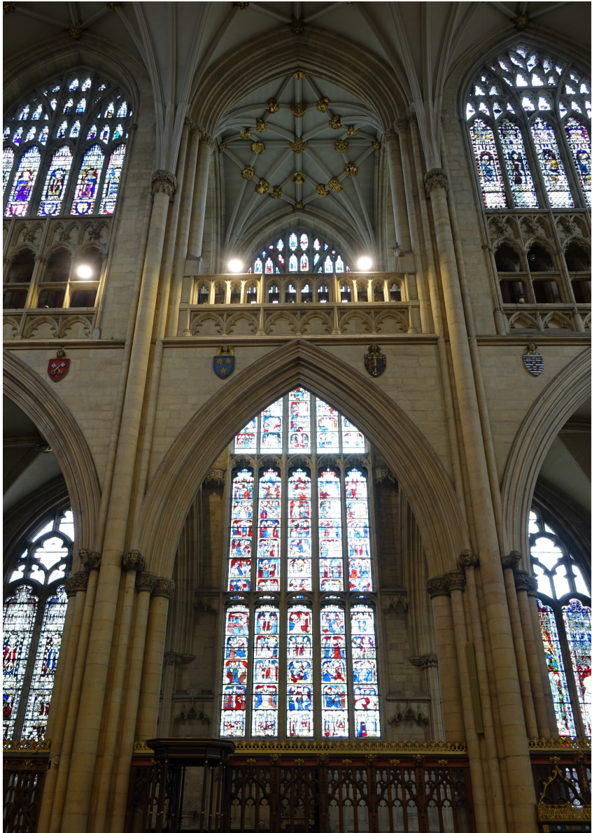
Abbildung 10: Wappen von St. Wilfrid und Arma Christi vor dem St. Williams-Fenster.