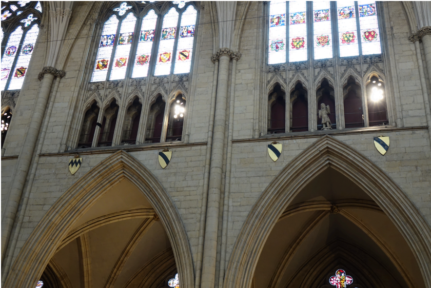
Abb. 5: Wappen der Familie de Mauley (Mitte) neben Wappen Stephen de Mauleys (rechts).