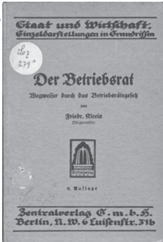
Abb. 2: Kontextabhängige Evidenzen: Aus Thüringen liegen Berichte vor, wonach Bibliothekare und Lehrer 1933 mit polizeilichen Ausweisen ausgestattet wurden und Buchhandlungen, Zeitungskioske und Leihbibliotheken nach zensierter Literatur durchsuchten. Der Großteil der beschlagnahmten Bücher wurde verbrannt oder makuliert. Einige Exemplare blieben in der Thüringischen Landesbibliothek Weimar als Referenzliteratur erhalten und wurden mit einem roten Punkt als zensiert markiert. Kratzspuren auf dem Einband des Buches aus dem Vorbesitz des Lesehallen-Vereins Pössneck deuten heute auf die Tilgung eines roten Punktes (KSW/HAAB Soz 279s) 29