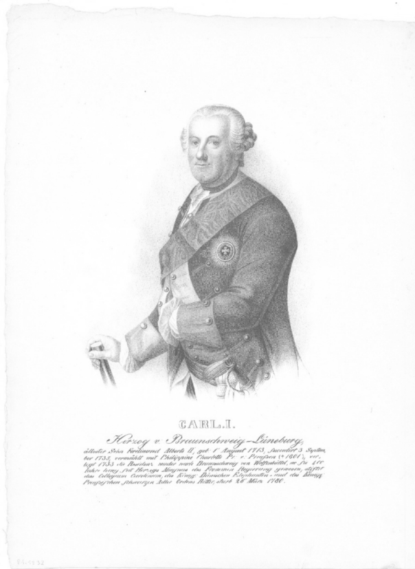
Abbildung 1: Altersportrait Herzog Karl I. Verlag Trackert & Co, Lithographie nach einem Kupferstich von Antoine de Marcenay de Ghuy (1724–1811), Braunschweig um 1840.