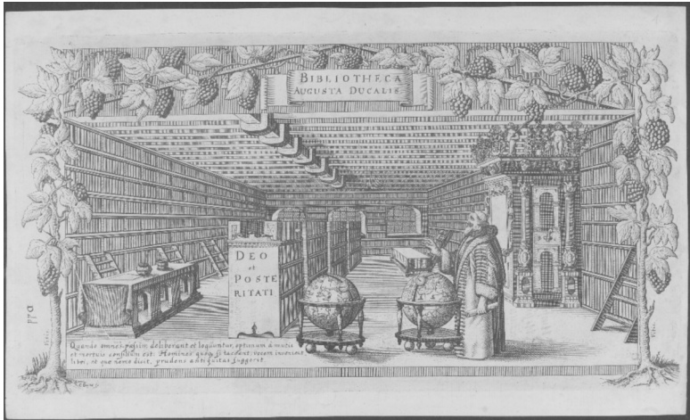
Abbildung 2: Herzog August d. J. in seiner Bibliothek in Wolfenbüttel. Conrad Buno (1613–1671), Kupferstich, 1650.

Quelle: Herzog August Bibliothek Wolfenbüttel, Top 1a: 3r.