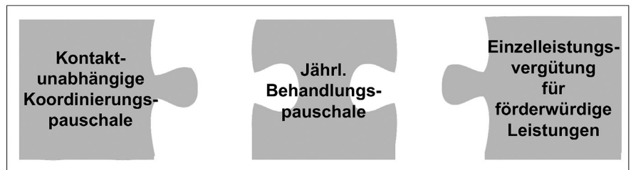
Abbildung 3: Dreigliederung der primärärztlichen Honorierung

Mit der Ausweisung einer jährlichen Behandlungspauschale geht die Quartalisierung der Abrechnung zu Ende, ein historisches Unikum, was noch aus der Zeit der Krankenscheinhefte herrührte. Damit wird auch die teilweise skurrile