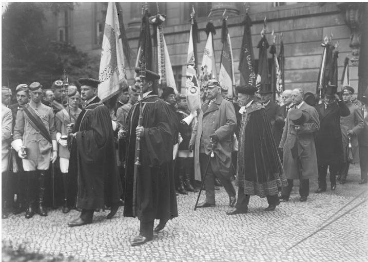
Abb. 29: Denkmalseinweihung für die Gefallenen der Berliner Universität, Reichspräsident von Hindenburg, der Rektor der Universität Pompeckj, dahinter Reichskanzler Marx und Kultusminister Becker vor einem Spalier von Studentencorporationen, Juli 1926.

Es war vor dem Hintergrund dieser geistigen Einstellung wenig verwunderlich, dass Becker die organisatorische und agitatorische politische Kraft, die sich insbesondere in revisionistischen Kreisen der Burschenschaft organisierte, vermutlich politisch unterschätzte. Immerhin war die Studentenschaft bereits 1919 in der Frage der politischen Zugehörigkeit gespalten in eine national-kulturelle Richtung und eine völkische, die teilweise offen antisemitisch war. Als sich im Sommer 1919 die Studentenschaft politisch organisierte, war die gewählte Definition der Zugehörigkeit entsprechend unscharf. »Die