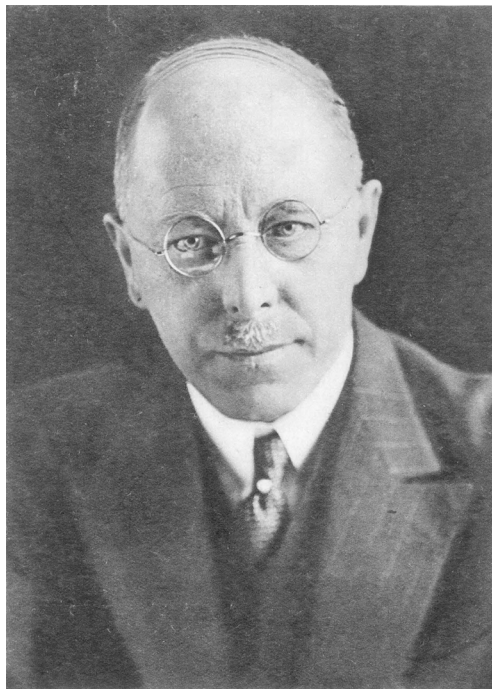
Abb. 28: Carl Heinrich Becker

Der Studienfreund und spätere badische Kultusminister Willy Helpach (1877–1955) beschrieb Beckers Habitus in einem Nachruf 1933 als den eines gepflegten und feinsinnigen Menschen.