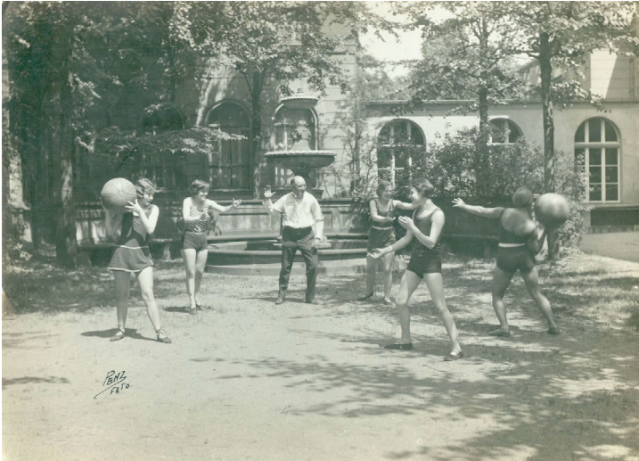
Abb. 30: Prof. Jessner mit Schauspielschülerinnen im Hof der Staatlichen Akademischen Hochschule für Musik Berlin, ca. 1928.

Das Foto war offensichtlich für die Außendarstellung der Schule bestimmt. Denn das dargestellte Ballspiel erschien bei näherer Betrachtung widersprüchlich, wenn nicht gar dysfunktional. Dies lag insbesondere an der Pose der Schülerin, die links neben Jessner stand. Sie deutete mit nach vorn geöffneten Händen und dem Ausfallschritt an, dass sie bereit oder im Begriff war, einen Ball zu fangen. Ihr stand jedoch keine Spielpartnerin gegenüber, auf deren Wurf sie sich vorbereiten könnte. Zwar schaute sie auf die Person ganz rechts. Diese schien jedoch bereits ihre Spielpartnerin, die Schülerin rechts neben Jessner, gefunden zu haben. Im Vordergrund wiederum gaben zwei Schülerinnen für sich ein Paar von Werferin und Fängerin ab. Die Schülerin links neben Jessner war die fünfte, die ungerade gezählte Person, die keine Partnerin und keinen Ball abgekommen hatte. Für sie hätte Jessner als Spielpartner fungieren müssen. Hemd, heller Schlips, Halbschuhe und Anzugshose markierten jedoch, dass dies nicht adäquat gewesen wäre. So weit ging die Gleichstellung nun doch nicht. Zudem drängt sich aus heutiger Perspektive die Geschlechts- und Altersdifferenz auf, die sich zwischen dem zünftig bekleideten Fünfzigjährigen und den in kurzer Turnkleidung und Schlappchen sich bewegenden Schülerinnen auftat.