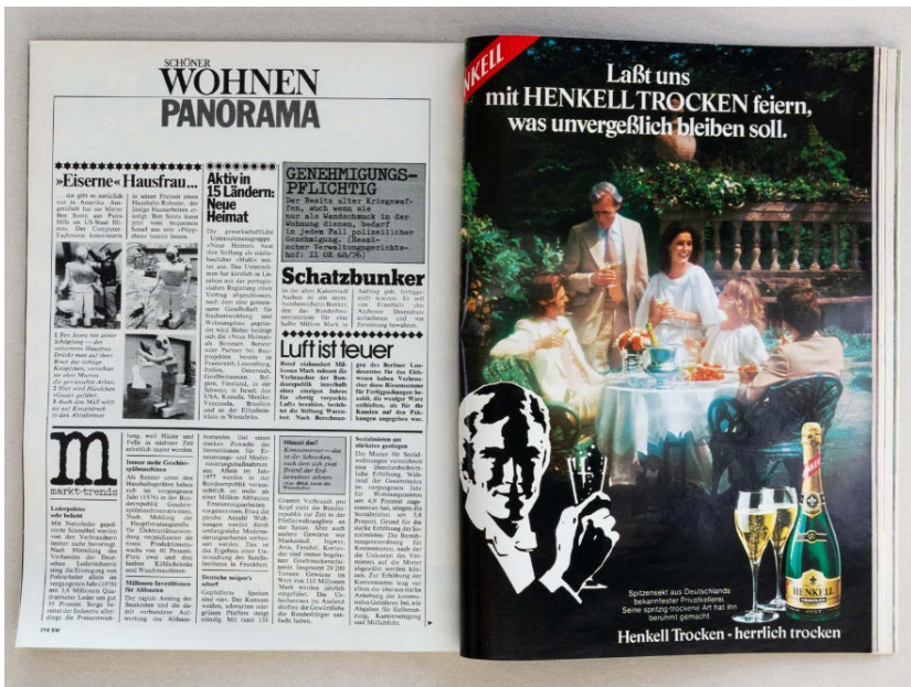
Abb. 3: Vergeschlechtlichte Roboter