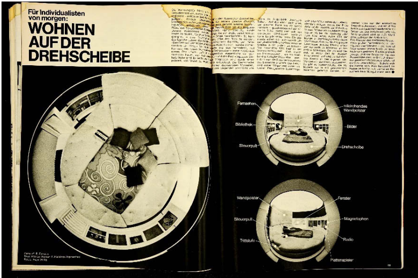
Abb. 1: Das Bett für Individualisten von morgen

Quelle: Halding-Hoppenheit, Roman F. Hiltram: »Für Individualisten von morgen: Wohnen auf der Drehschleibe«, in: Schöner Wohnen 10, Nr. 6 (1969), S. 180–181. Entwurf: B. Devaux, Fotos: Hajo Willig.