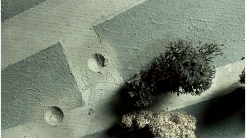
Abb. 21–23 Hiwa K, View from Above , 2017 (Stills, oben/Mitte: unterschiedliche Fokussierungen und (Un-)Schärfe-Verhältnisse; unten: erkennbar sind Pflanzen, Farbauftrag mit aufgemalten Straßenlinien, runde Einkerbungen von Detonationskratern)