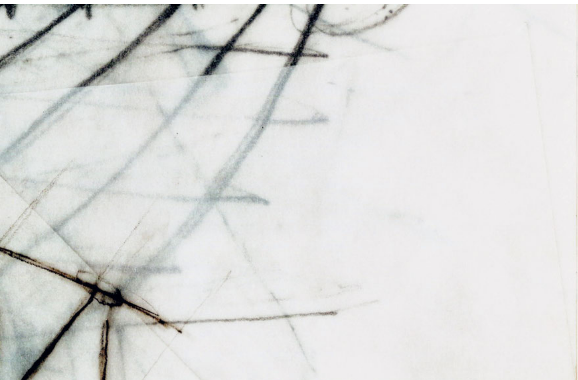
Abb. 2: Instanziierung einer Überlagerungen von 6B-Skizzen auf transparentem Papier, Zeichnung des Autors.