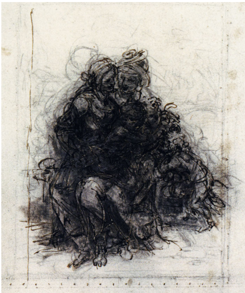
Abb. 1: Leonardo da Vinci, Maria und Anna mit Jesus und Johannes dem Täufer, Detail eines Studienblattes, 1506, Kohle, Feder, Aquarell, 26 x 19,5 cm, British Museum, London, Inv.-Nr. 1875-6-12-17.

»Etwas wehmütig denken wir an unsere alten 6B-Skizzen, scheinbare Schmuddel-Skizzen, die unscharf waren, in denen man, wenn sie durch fortwährendes Überzeichnen zu kleinen Papierhügeln angewachsen waren, plötzlich Dinge durchscheinen sah, durch mehrere Lagen transparenten Papiers; Dinge, die man nicht kannte bis dahin; Dinge, die man nicht gezeichnet hatte, die einfach so entstanden sind, scheinbar aus sich selbst heraus.« 6