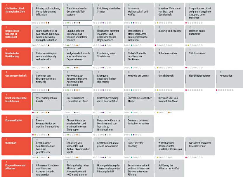
Bild 1. Schema für die Entwicklung von Strategieoptionen (Ausschnitt aus dem Tool): rotgefärbte Kästchen sind strategische Handlungsfelder, graue Kästchen rechts davon sind Handlungsoptionen und die Kombination der eingerahmten grauen Kästchen bildet eine Strategieoption.

Abschließend wird in einer Strategie-Landkarte visualisiert, wie und unter welchen Rahmenbedingungen sich die einzelnen Strategien in die Zukunft entwickeln können. Die Visualisierung erlaubt es, Entwicklungspfade, potentielle Strategiewechsel und Zielzustände frühzeitig zu erkennen und gezielt Gegenmaßnahmen zu planen. Berücksichtigt werden dabei insbesondere jene Strategieoptionen, die in den einzelnen Phasen des hybriden Konflikts identifiziert wurden. Die Strategie-Landkarte macht sichtbar, wie diese Optionen miteinander verknüpft sind, wo Schnittstellen und Übergänge zwischen den Phasen verlaufen und welche Pfade zu Eskalation, zur Erreichung des Endzieles oder auch zu einem Scheitern führen können.