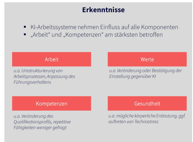
Bild 2. Einfluss von KI-Arbeitssystemen auf die Arbeitsfähigkeit. Grafik: eigene Darstellung

Angst und Stress können durch den Einsatz von KI-Arbeitssystemen die Gesundheit von Mitarbeitenden belasten. Dies trifft vor allem dann zu, wenn Mitarbeitende nicht ausreichend über die Folgen einer solchen KI-Implementierung in Hinblick auf die Bedeutung der Beschäftigungssicherheit aufgeklärt werden und dies in ein Gefühl von Unsicherheit und Angst mündet. Auch hier betonen die Teilnehmenden die Notwendigkeit einer transparenten Kommunikation und Aufklärung seitens der Führungskraft. Doch auch wenn das Arbeitsverhältnis nicht gefährdet wird, können Gefühle von Angst und Stress ausgelöst werden, wenn Mitarbeitende eine Unsicherheit im Umgang mit der KI verspüren. Diese kann entstehen, sobald sich ein wahrgenommener Kontrollverlust bemerkbar macht, welcher der mentalen Gesundheit schaden kann. Hier kann es helfen, durch eine transparente Aufklärung zur Funktionsweise und der Grenzen einer KI Unsicherheiten und Ängste in der Anwendung zu reduzieren. Positiv kann sich der Einsatz von KI auf die Gesundheit auswirken, sobald die Technologie als kognitiv oder körperlich unterstützend wahrgenommen wird. Können zudem einige Tätigkeiten durch die KI