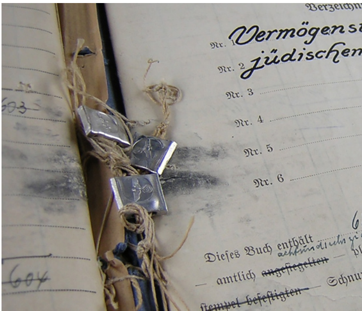
Abb. 1: Detail aus dem Kassenbuch der Finanzkasse Bremen Ost. (StAB 4,42/3-4)

Da die meisten Rückerstattungsanträge über Gegenstände geführt wurden, die wie die Lifts mit Umzugsgut durch das Deutsche Reich entzogen worden waren, entstanden Fallakten auch bei den Oberfinanzdirektionen, so auch in Bremen. Eine Durchsicht von Fallakten aus Bremen, die lange Zeit bei der Oberfinanzdirektion in Hannover lagerten, hat ergeben, dass der Inhalt der Akten des Landesamts für Wiedergutmachung und der Oberfinanzdirektion weitgehend identisch ist, da alle Unterlagen in doppelter Ausfertigung eingereicht werden mussten.