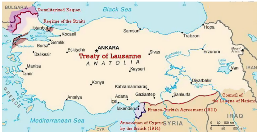
Abb. 5: Grenzen der Türkei nach dem Abkommen von Lausanne 1923