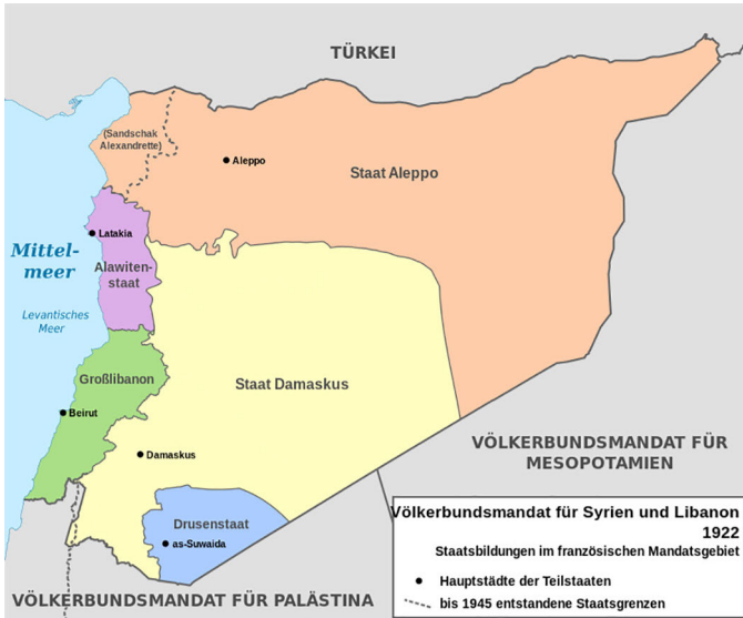
Abb. 6: Die syrischen Staaten unter französischem Mandat 1922