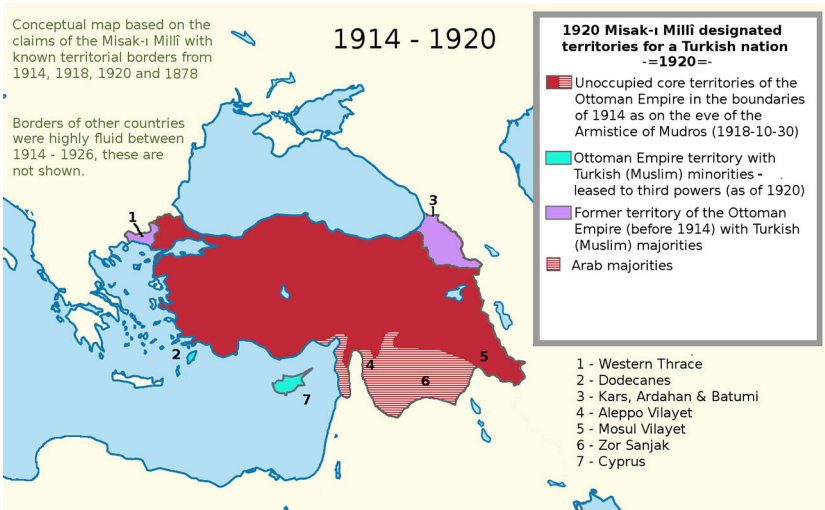
Abb. 4: Die Grenzen des Misak-ı Milli Abkommens