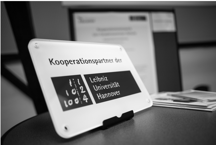
Abb. 2: Kooperationssiegel.

Dies wird ergänzt durch die Zusammenarbeit zwischen Fachwissenschaften, Fachdidaktiken sowie den Bildungswissenschaften innerhalb der LUH . Für eine Intensivierung universitätsinterner Zusammenarbeit und eine gemeinsame inhaltliche und organisatorische Ausgestaltung der Lehrkräftebildung entstand bspw. die Leibniz Konferenz Lehrkräftebildung (LKL) . Anstoß gab die Corona-Pandemie und die damit verbundenen Schulschließungen, die es notwendig machten, Ersatzleistungen für nicht stattfindende oder abgebrochene Schulpraktika zu eruieren. Praktikumsverantwortliche aus Fachdidaktiken, Fachwissenschaften, Erziehungswissenschaft sowie die LSE fanden hier ein Format, sich über Institutsgrenzen hinweg auszutauschen. LSConnect entwickelte in der Folge schließlich das bereits erwähnte Projekt #LernenVernetzt .