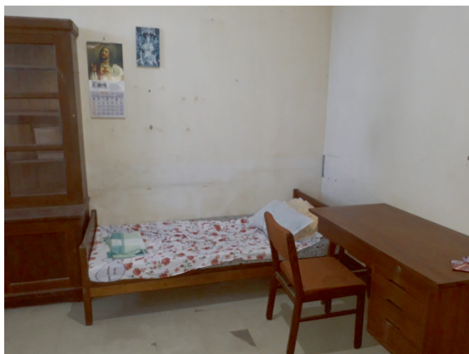
Abb. 3 Balweg Zimmer im Regionalhaus der SVD, Bangued-Ubbog

Nach einigen Tagen aber tauchte Balweg unter. Freilich hatte er dies bereits vorbereitet: Die 14.800 Pesos für den Bau eines Internats in seiner Pfarrei Sallapadan und ca. 10.000 Pesos auf dem Gemeindekonto waren verschwunden. 57 Wahrscheinlich hat sie Balweg mit in die Berge genommen.